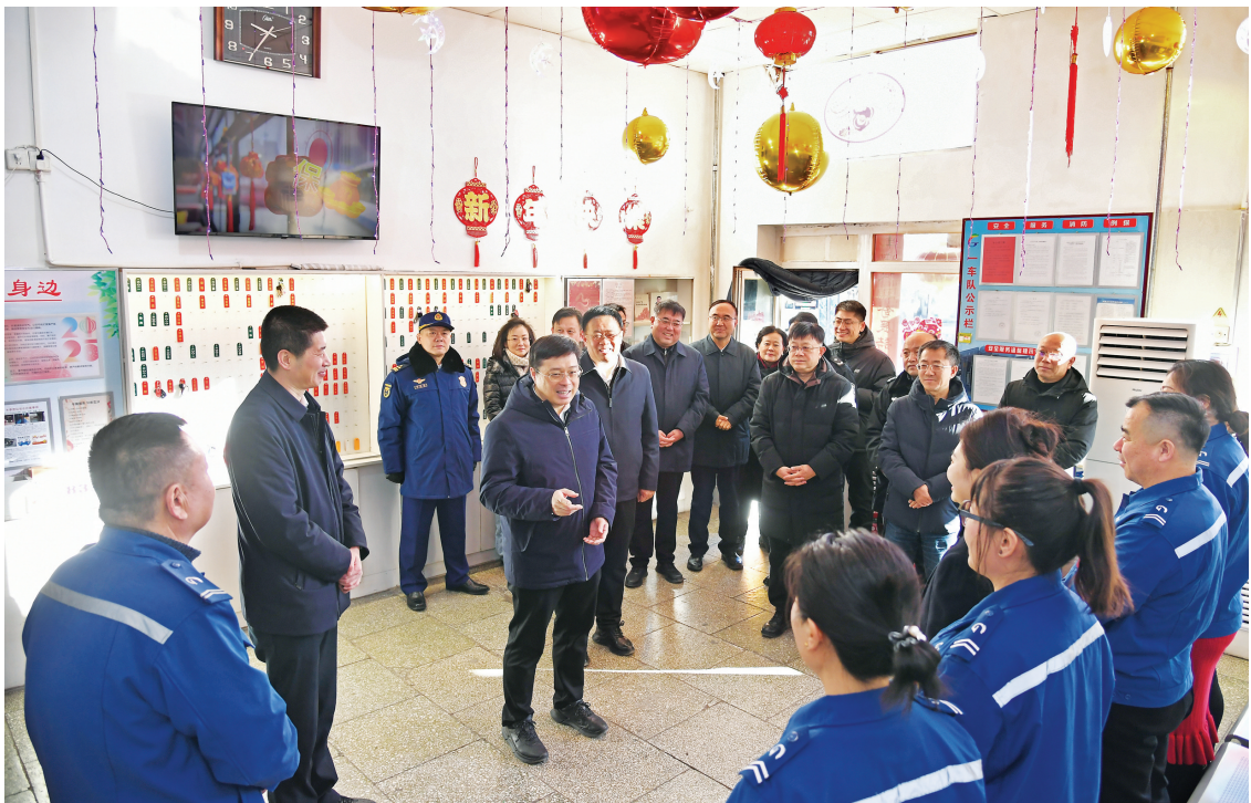
省委常委、市委书记韦韬在太原公交集团调度中心，慰问一线公交职工。