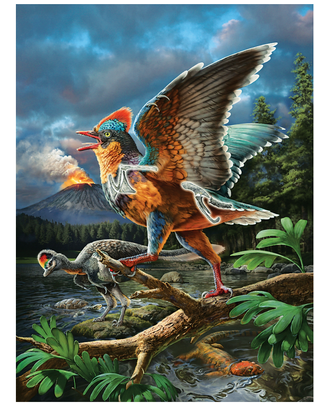
政和八闽鸟和政和动物群生态复原图。