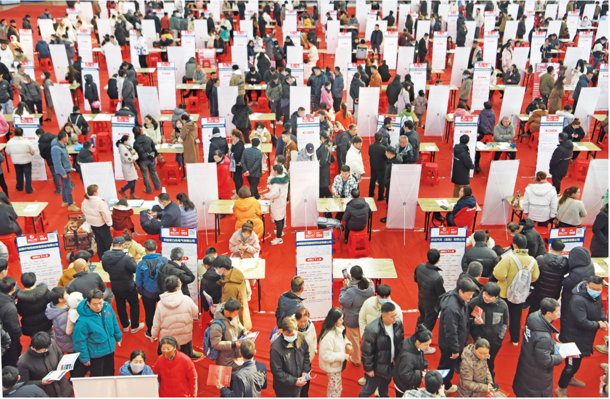
2月15日，求职者在安徽省淮南市2025年“春风送暖”招聘会现场了解招聘信息。时值周末，各地举行形式多样的求职招聘活动，为用人单位和求职者搭建沟通桥梁。

2月16日，宁夏银川市兴庆区实验二小学生在展示领到的新课本。 当日，部分地区中小学迎来开学季，学生们返回学校、领取教材，参加开学第一课等活动，开启新学期。