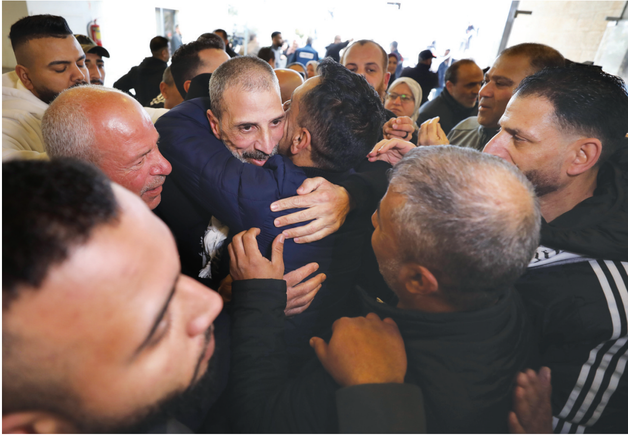
2月15日,在约旦河西岸中部城市拉姆安拉,获释人员受到人们欢迎。巴勒斯坦在押人员协会主席阿卜杜拉·扎加里15日说,以色列当天释放了369名被扣押人员。当天,大多数获释人员被送往加沙地带,部分获释人员被送至约旦河西岸中部城市拉姆安拉。