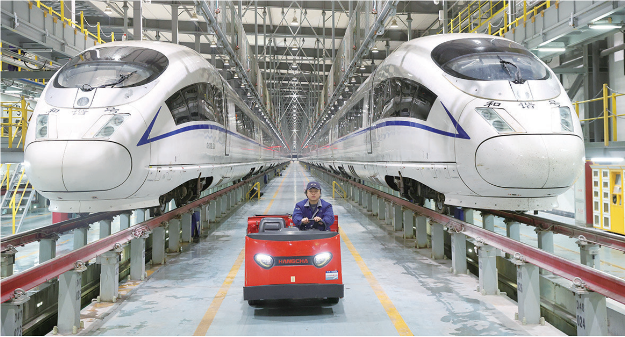
2025年1月22日晚，工作人员驾驶送料小车为检修库内的作业人员送去工具和配件。