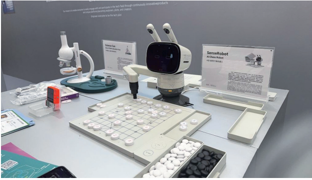
在2025全球开发者先锋大会“模速空间”专场展示的人工智能下棋机器人。