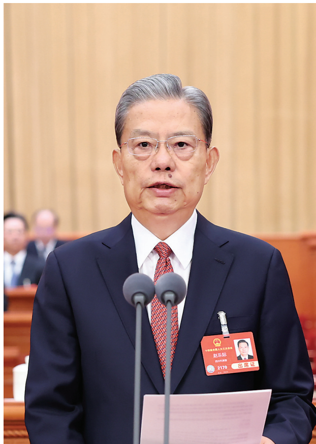
3月5日上午，第十四届全国人民代表大会第三次会议在北京人民大会堂开幕。赵乐际主持开幕会。