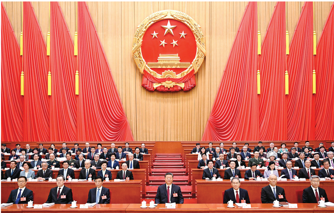
3月5日，第十四届全国人民代表大会第三次会议在北京人民大会堂开幕。党和国家领导人习近平、李强、王沪宁、蔡奇、丁薛祥、李希、韩正等出席大会。