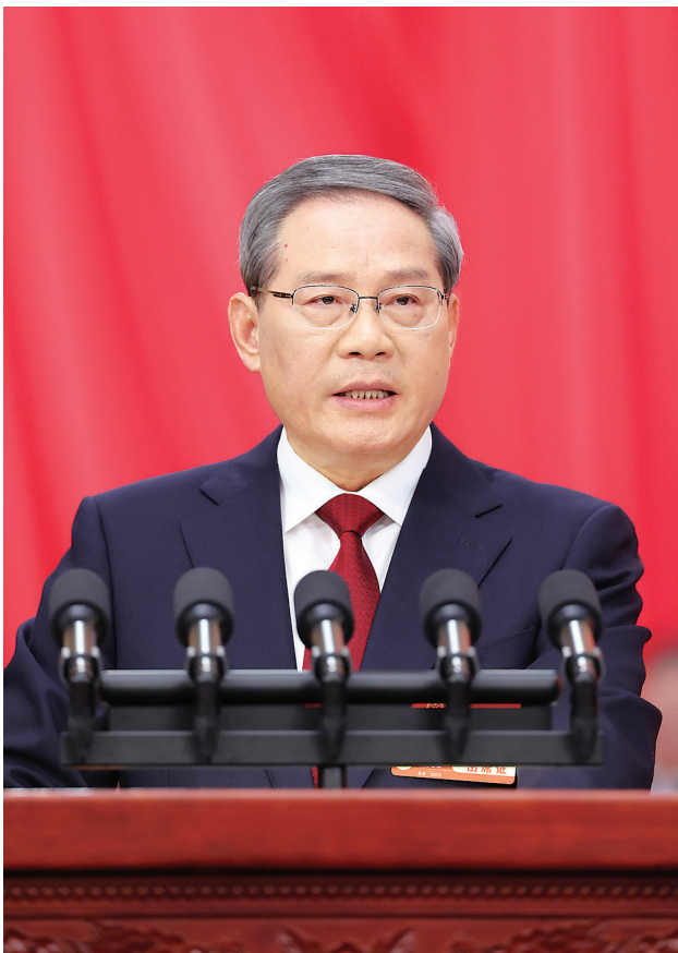
3月5日上午，第十四届全国人民代表大会第三次会议在北京人民大会堂开幕。国务院总理李强作政府工作报告。