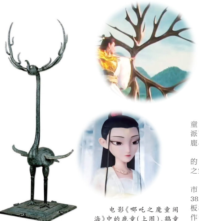
鹿角立鹤(湖北省博物馆藏)

鹿角立鹤于1978年在湖北省随州市曾侯乙墓出土,通高143.5厘米,重38.4公斤。器身由鹤身、鹤腿、鹿角、底板榫接组成,鹤为长颈圆首,尖嘴上翘作钩状,硕腹拱背,翘展尾垂,高腿扁足,头两侧生有枝杈从生,朝上内卷呈圆弧状的一对鹿角。鹤颈部右侧有铭文一行七字:“曾侯乙作持用终。”这件