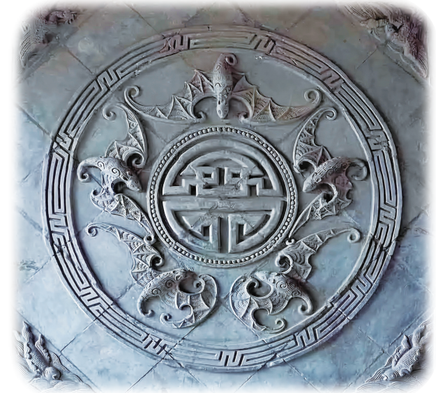
晋祠内的“五福捧寿”砖雕内壁