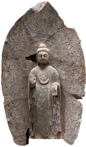
汉白玉石造佛像 (太原市博物馆藏)