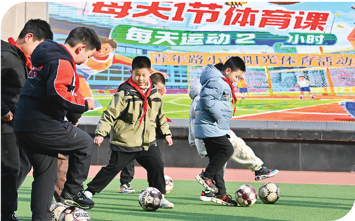
3月12日，太原青年路小学的孩子们在进行体育活动。