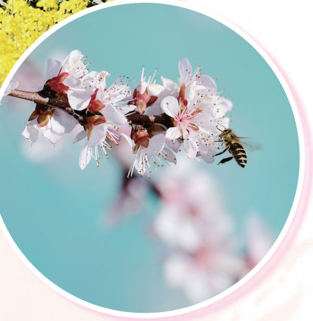
▲3月21日,北京市西城区白纸坊桥护城河畔,盛开的桃花引来蜜蜂。