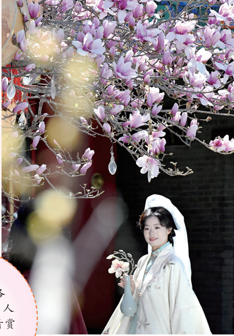
▼3月21日,游客在河北省石家庄市正定县荣国府影视拍摄基地赏花拍照。

防“跑火”。 一是开展农事用火之前,要向所在地的村民委员会或居民委员会办理野外用火的审批手续。村民委员会或居民委员会要督促用火单位和个人采取相应的防火措施,要落实监管用火现场的责任人。同时,要事先清理邻近林地和草地的边缘可燃物,形成隔离带。 二是在用火时要关注天气预报,严禁在高温和大风天气用火。一般要在火险天气等级三级以下才能用火,用火时要携带灭火工具,注意看守,要做到“用火不离人、离人不用火”。 三是用火之后,要全面检查用火区域,用土或者水来熄灭余火,并且要确保明火全部熄灭后才能离场,做到“残火不过夜”。