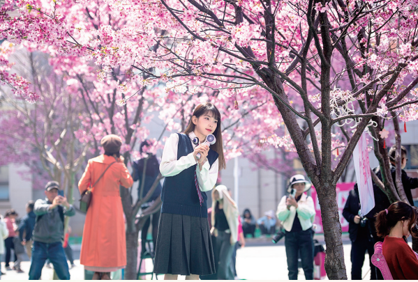
▲3月21日,游客在湖南省长沙市晚安家居文化园的樱花树下拍照。