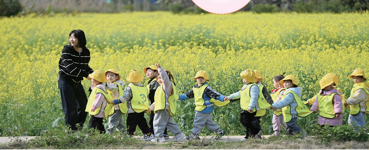
▲3月21日,在广西柳州市融水苗族自治县融水镇新国村,小朋友在老师的带领下到油菜花地踏青游玩。