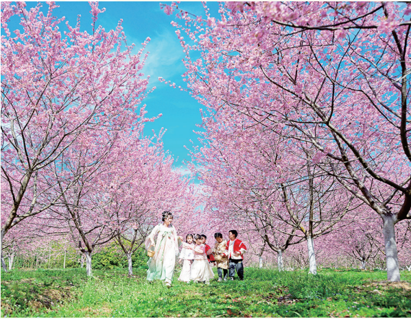
▲3月21日,游客在安徽省滁州市全椒县马厂镇龙山樱花园踏青游玩。