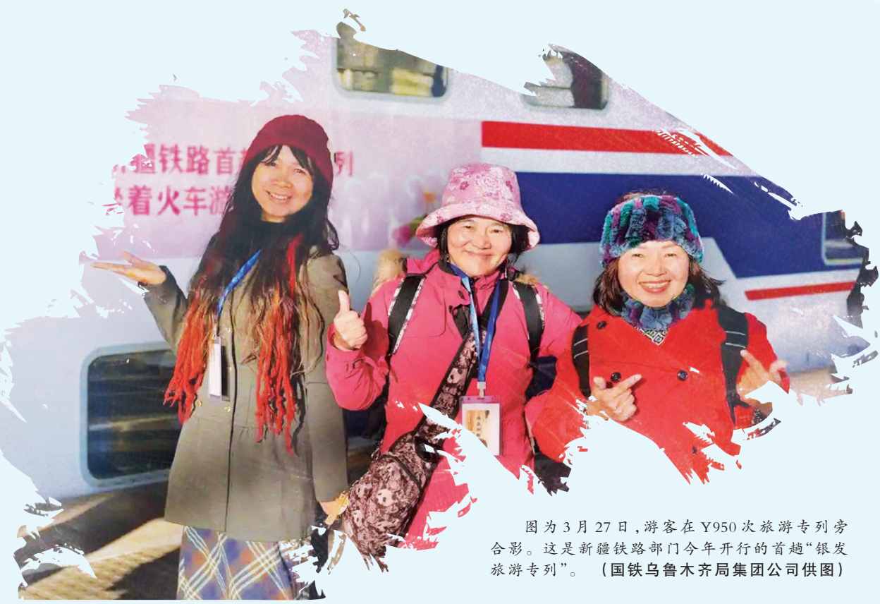
图为3月27日,游客在Y950次旅游专列旁合影。这是新疆铁路部门今年开行的首趟“银发旅游专列”。

新疆铁路部门深入开展市场调研,积极推动铁路和旅游融合发展,丰富旅游市场供给,增进老年群体福祉。