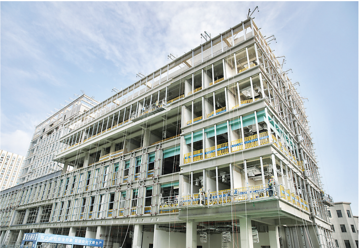
4月19日，山西省残疾人综合康复中心二期工程现场，工人们正在进行内外装饰装修施工。该项目是国家“十四五”规划社会服务领域102项重大项目之一，也是山西省重点民生工程，目前该项目主体结构、二次结构及屋面工程已全面完工，施工进度已完成80%。