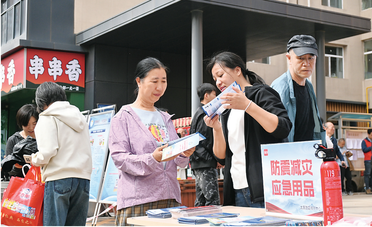
5月8日，由太原地震监测中心站、太原市防震减灾中心、杏花岭区防震减灾中心主办的太原市2025年社区防震应急演练在羊坊西街举行。通过应急演练、科普宣传，普及防震应急知识。