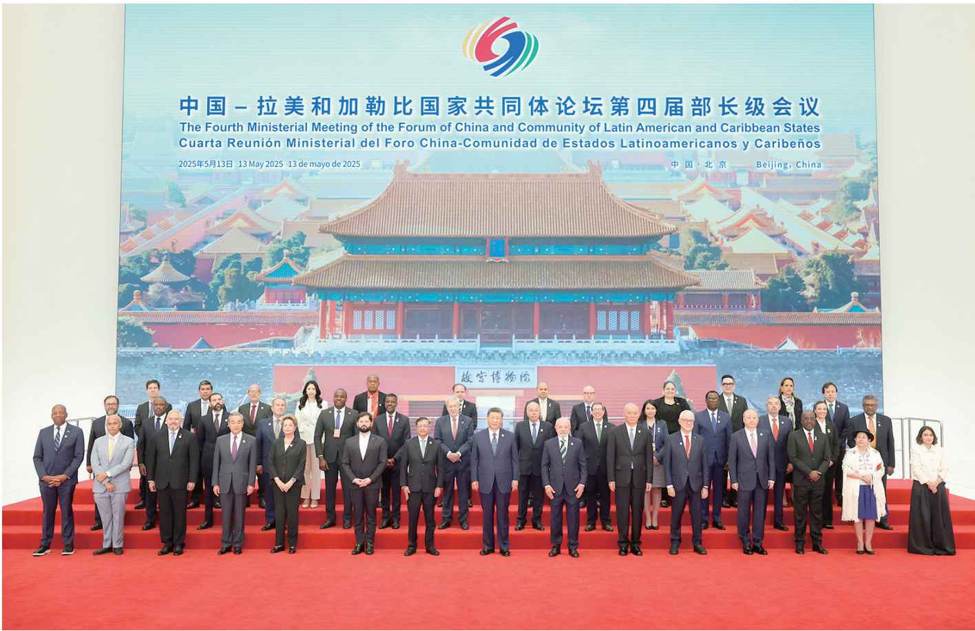
5月13日上午，国家主席习近平在北京国家会议中心出席中国—拉美和加勒比国家共同体论坛第四届部长级会议开幕式并发表主旨讲话。这是习近平同与会嘉宾集体合影。