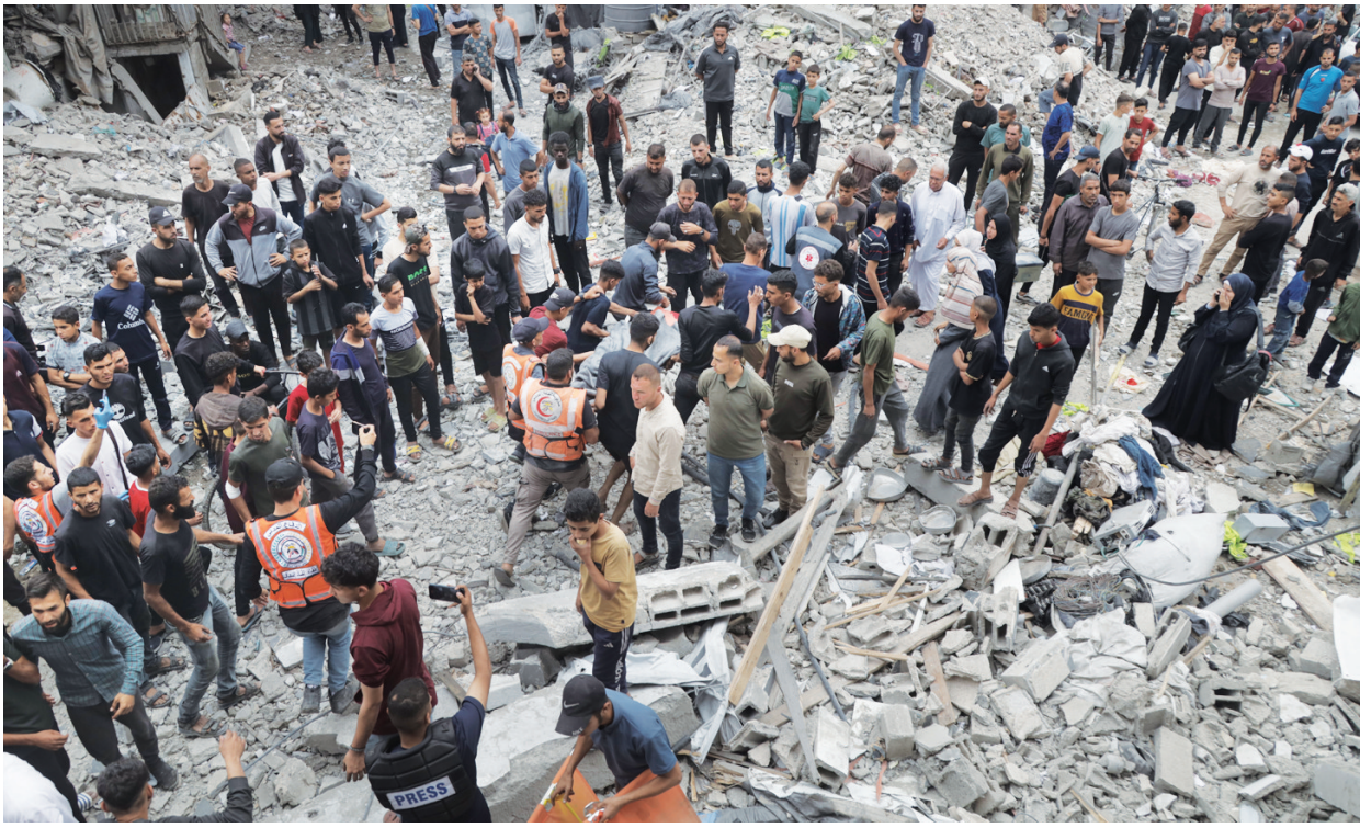
5月15日,在加沙地带北部杰巴利耶难民营,人们在以军轰炸后开展救援。据巴勒斯坦通讯社15日报道,以色列军队当天轰炸加沙地带多地,造成包括儿童和妇女在内的至少82人死亡。

中美经贸高层会谈5月10日至11日在日内瓦举行。此次会谈达成重要共识,并取得实质性进展。据美国白宫5月12日发布的行政令,美方已于美东时间5