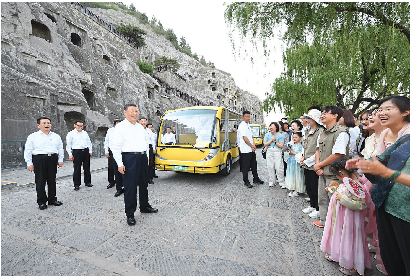
5月19日至20日，中共中央总书记、国家主席、中央军委主席习近平在河南考察。这是19日下午，习近平在洛阳龙门石窟考察时，同游客亲切交流。

19日下午，习近平首先来到洛阳轴承集团股份有限公司考察。该公司前身为“一五”期间建成的洛阳轴承厂。在智能工厂，习近平了解企业发展历程，听取不同类型轴承产品用途和性能介绍，走近生产线察看生产流程。他对