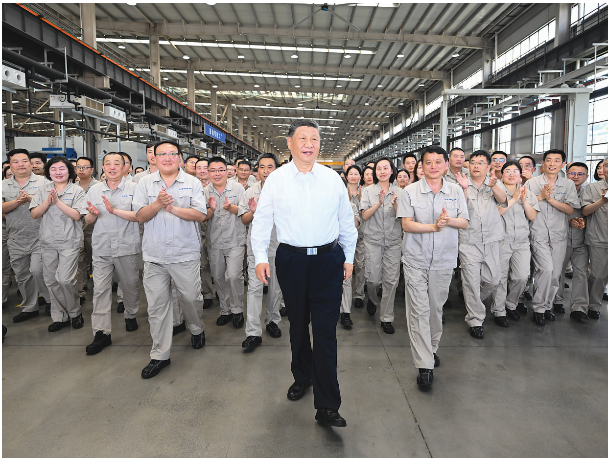
5月19日至20日，中共中央总书记、国家主席、中央军委主席习近平在河南考察。这是19日下午，习近平在洛阳轴承集团股份有限公司智能工厂考察时，同企业职工在一起。