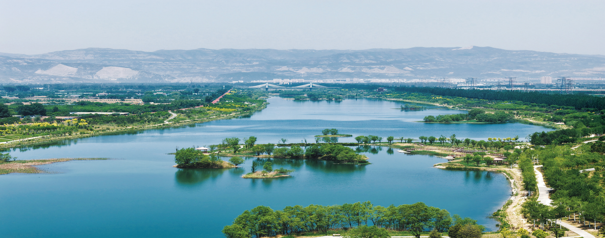
5月21日,小满至,夏意浓,万物渐丰盈。汾河四期绿意盎然,勾勒出一幅清新静谧的生态画卷。

此外,国铁太原局综合公、铁、海物流优势,根据企业物流需求“量身定做”物流产品,开发物流总包及“总对总”项目,锁定运量超1亿吨。同时,不断完善货物班列产品谱系,国铁太原局以山西“十大专业小镇”“十大产业链”链上企业为着力点,推出“三晋通”班列、晋蜀钢铁班列、晋粤山西特产班列等多种班列产品,为民生物资提供干支仓配一体化服务,积极推进铁水“一单制”物流,构建起全国1、2、3天快货物流圈,开行14条中欧班列物流线路,辐射“一带一路”16个国家48个城市,有效降低了全社会综合物流成本。 (齐向真)