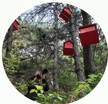
乌金山天缘谷

山有几重,乌金山的魅力就有几重。当日出穿透弥漫山间的云雾,由黄土夯筑的山峦露出它典型的北方面孔,壮丽而雄浑。对话自然过后,听乌金山狂欢谷传来沸腾人声,万千游客尽情体验各种游乐项目,人文与自然在这里碰撞、融合。感受自然的宁静与浪漫,不止有远山——离开城市的喧嚣,在瑞云汇景房车露营地,看风吹树叶,观星光闪烁,便足以让人放下生活的压力,沉醉于休闲时光。除了壮美的自然风光,古建亦是这片文旅热土上绕不开的话题,榆次老城里,古建别具匠心的整体构造,层叠繁复的斗拱、藻井,镌刻着百年来的厚重历史记忆,让人不由驻足。近年来,晋中市深挖文化与旅游资源,不断提升文旅品质,持续擦亮“怡然见晋中”城市文旅形象,书写出文旅融合高质量发展的新篇章。