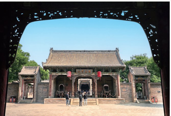
榆次老城县衙