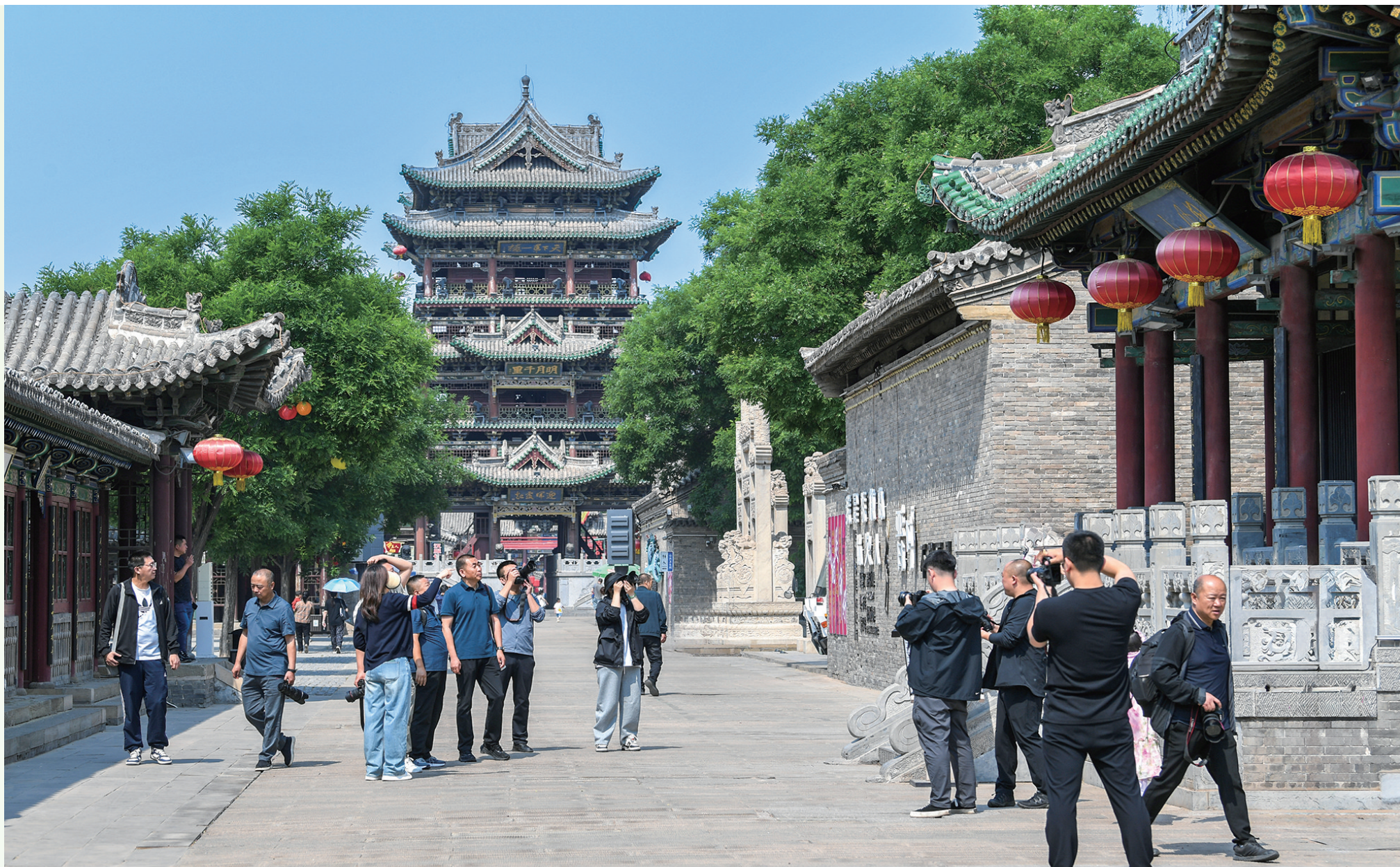
榆次老城街景