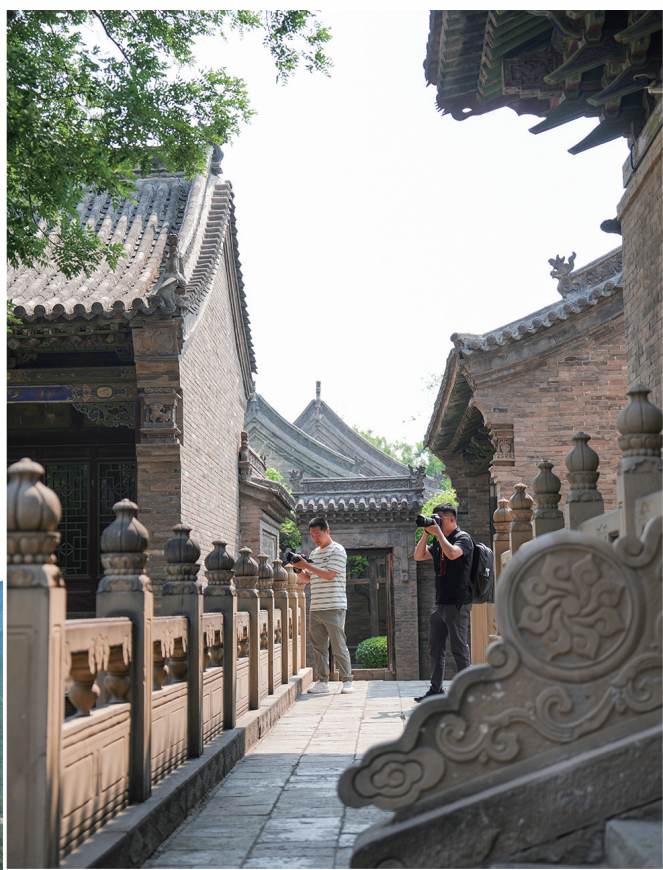
榆次老城县衙内景