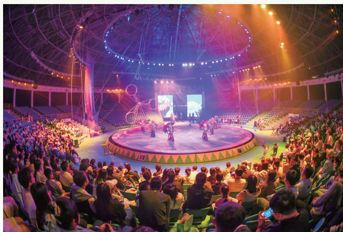
五国大马戏

活动期间,太原日报社、晋中日报社、忻州日报社、吕梁日报社、阳泉日报社的记者深入乌金山旅游区、榆次老城、瑞云汇景房车露营地,通过实地走访,对话山水草木,追溯历史岁月,探寻人文印记,深度感受晋中文旅产业火热发展的实践成果,用镜头展现“怡然见晋中”城市文旅形象。