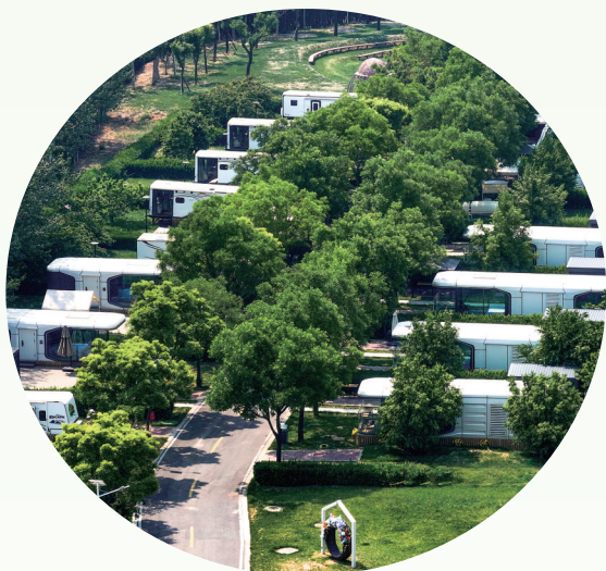
瑞云汇景房车露营地