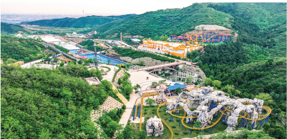
乌金山狂欢谷