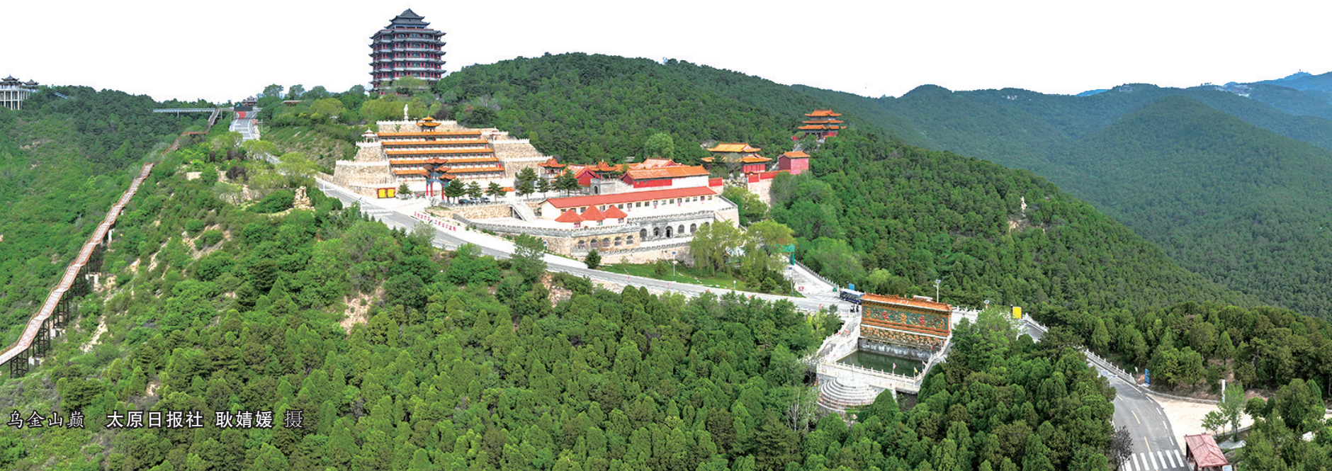
乌金山麓 太原日报社 耿婧媛 摄