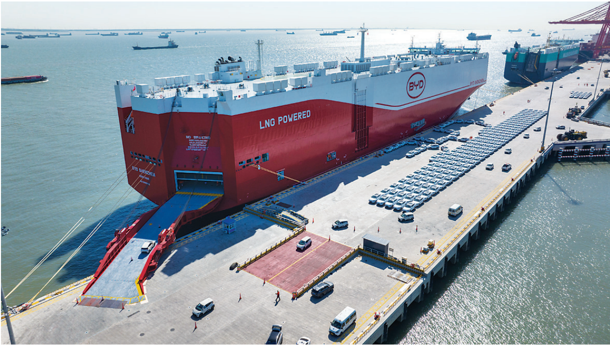
出口汽车在苏州港太仓港区码头集中装载上“深圳号”汽车运输船(2025年4月26日摄，无人机照片)。

等用车需求成为更多人的核心考量因素。消费者心中的“价值秤”，往往比“价格标签”更有分量。 在江汽集团董事长项兴初看来，破除“内卷”难题的关键是要坚持以用户为中心，通过持续的科技与产品创新来满足用户的差异化需求，并真正为消费者创造附加价值。 李云飞告诉记者，比亚迪将继续坚持技术创新，加大研发投入，持续提高技术、产品和服务的综合竞争力，更好地满足消费者需求和维护消费者利益，助力汽车产业高质量发展。 “蔚来汽车坚定在研发和基础设施建设上投入，截至目前，已在全国建成3341座换电站，提供的换电服务超过7500万次，未来将继续升级充换电网络技术。”李斌说。 当前，从全固态电池、分布式电驱动力系统、自动驾驶大模型等全链条关键技术，到车规级芯片、车用操作系统、专用工具软件等，不少前沿技术领域内，我国新能源汽车产业仍需持续攻关。 日前举行的第三届未来汽车先行者大会上，中国国际贸易促进委员会汽车行业分会会长王侠表示，当下的汽车产业革命最重要的特征就是技术变革，如果没有持续的技术创新，竞争力就无从谈起。 “搞研发是练内功，而‘价格战’是消耗内功。如果因为‘价格战’而减少了对研发的投入，即使赢了眼前的市场，也会输掉未来。”王侠说。