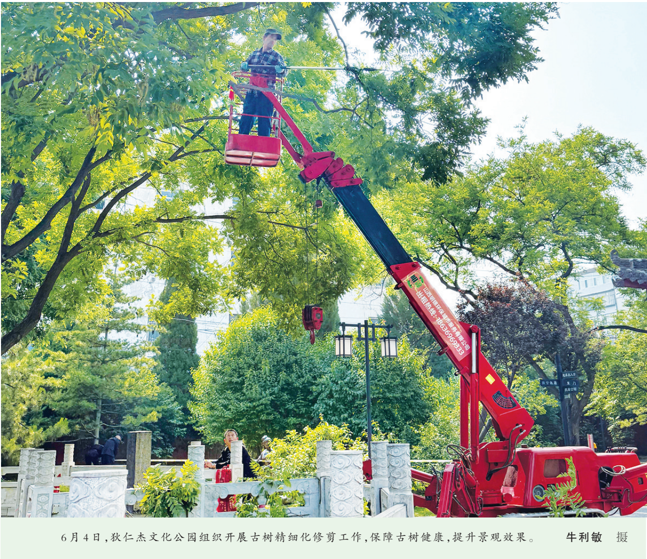
6月4日，狄仁杰文化公园组织开展古树精细化修剪工作，保障古树健康，提升景观效果。

据介绍，该星将创下山西高校三项航天纪录：首颗自主研发的智能卫星、首个“设计—制造—测控”全流程贯通的教学科研平台、首个多用途载荷平台。其技术体系深度融合中北大学仪器科学与兵器工程学科优势，成为中北大学“双一流”学科交叉的典型成果。作为“中北大学——太行星座”计划首发星，“中北大学一号”构建了完整的全生命周期技术体系。中北大学航空宇航学院将以该星发射为起点，推进128颗卫星组网计划，通过航天技术创新实践助力中北大学“双一流”学科建设和山西产业转型升级。（张晓丽、胡慧萍）