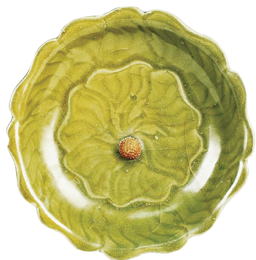
元龙泉窑青瓷葵口荔枝盘(浙江省博物馆藏)

此盘诞生的14世纪，正值龙泉窑外销的鼎盛时期。青瓷的制造技术也正是通过海上丝绸之路深刻影响了亚欧制瓷业发展，至今全球47个国家200余家博物馆收藏有龙泉青瓷，成为中华物质文明的世界性符号之一。