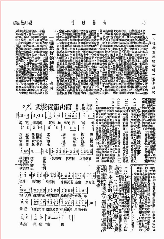
《大声》复刊号第8版

1938年3月12日成都出版的《大声》复刊号第8版刊登的《武装保卫山西》，是笔者目前看到的这首歌曲最早的版本。