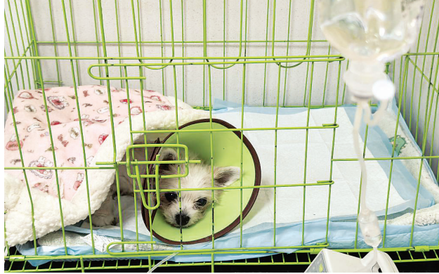
沈阳市一家宠物医院内,一只宠物狗正在挂吊瓶。

各地还充分发挥农机专业合作社、农机服务公司力量,提高社会化服务能力,争分夺秒抢收入库。 减损也是增收。今年江苏大力推广新型低损高效收获机械和专用收获机械,提前开展机收减损宣传、培训等活动,加强机收损失率监测,最大限度降低夏粮机收损失。 不断更新的麦收速度,见证着农业现代化的发展。放眼广袤田畴,“藏粮于地、藏粮于技”在田间地头激发出澎湃动能,大国粮仓的根基更加稳固。 新华社记者(据新华社北京6月9日电)