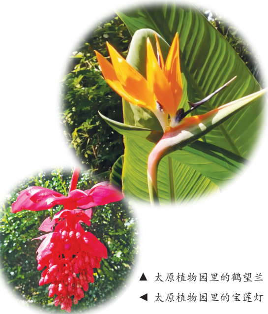
▲ 太原植物园里的鹤望兰 ▲ 太原植物园里的宝莲灯

上巳节，我去阳曲县杨兴乡全国重点文物保护单位帖木儿塔参观时，看到黄土高坡随口吟诵：“对坝圪梁空寂寞，高原土厚翻沟壑。城中上巳杏花开，旷野黄风冬景色。”玉虎哥又及时和诗：“上巳荒凉勿落寞，高原景致在沟壑。金秋九九到重阳，再看如波红叶色。”