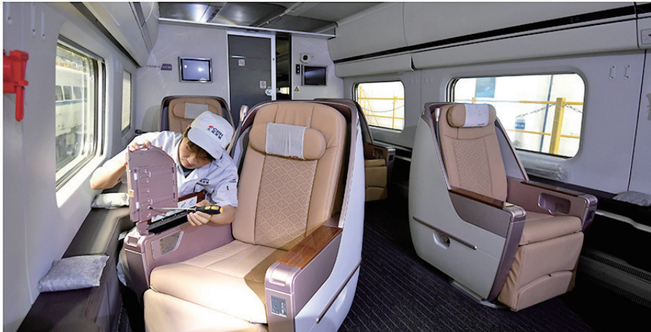
6月26日，太原车辆段大动车所工作人员对首组经过提质改造的CRH5型车进行调试维护。该列车增加了复兴号标准型蛋壳式商务座舱，可满足旅客的不同需求。