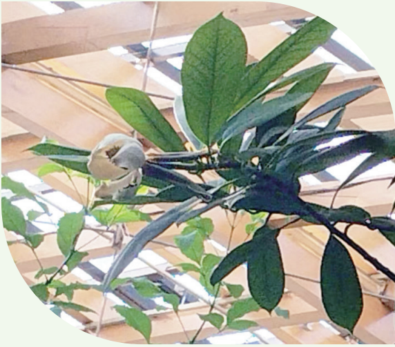
太原植物园热带雨林馆内，长梗木莲首次开花。