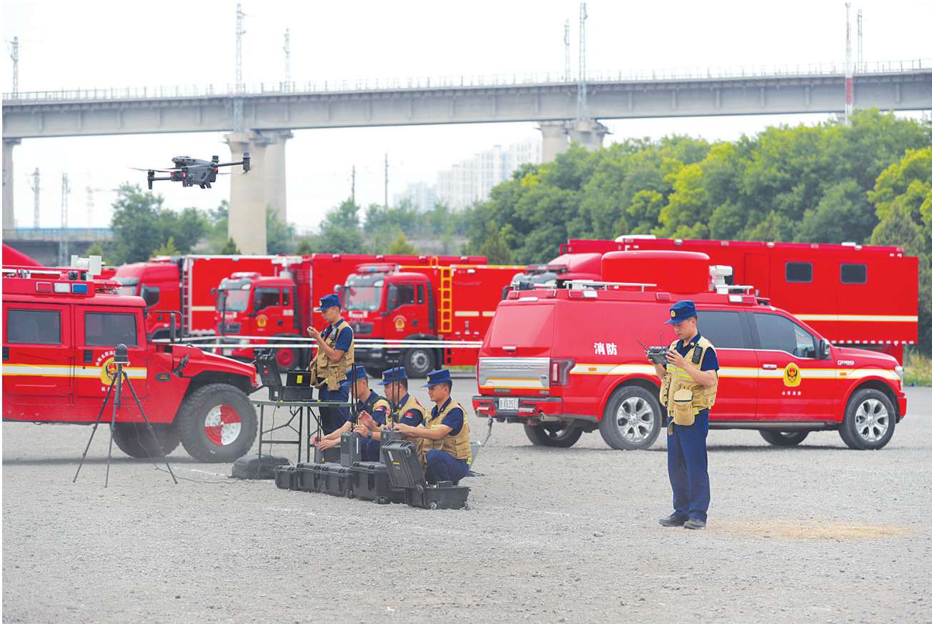
7月2日，太原市消防救援支队省级专业队重型地震救援队开展地震救援例行训练，通过模拟构建真实地震灾害场景，设置倒塌建筑搜救、安全破拆等科目，开展全流程实战化演练，提升全体队员的地震救援专业技能与团队协作水平。