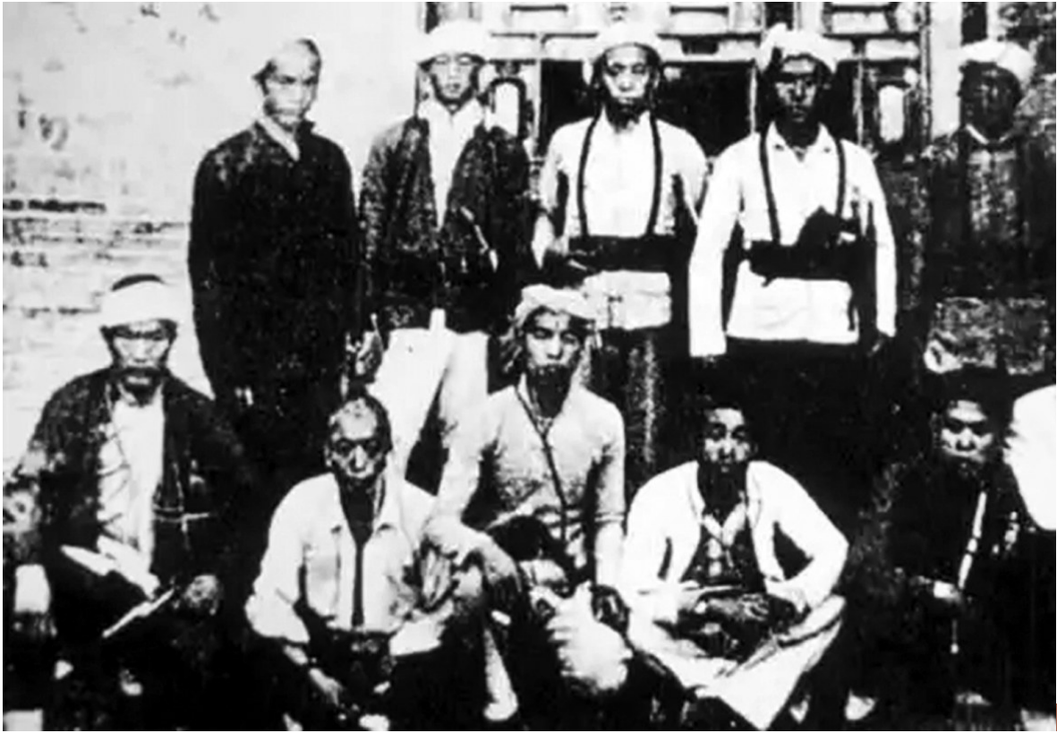
战斗在清徐徐平川的游击队员（资料图片）。

乔武村位于旧清源县城南15华里处，紧靠汾河，是贯穿汾河东西两岸的一处重要渡口，地势险要。自清太徐沦陷后，日军为封锁吕梁、太行革命根据地往来，阻止共产党、八路军开展平川抗日工作，在乔武村北头的四合院扎下据点，派四五名日军和一个伪军中队驻于其中。乔武村敌据点工事坚固，院外挖有战壕，院内拉着网，屋顶筑岗楼，门口岗哨昼夜把守，构筑起看似坚不可摧的防线。