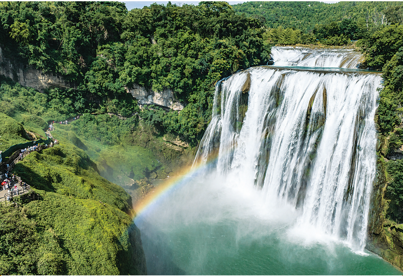
7月16日，游客在贵州省安顺市黄果树瀑布景区游览(无人机照片)。近日，位于贵州省安顺市的黄果树瀑布景区正处于夏日最佳观赏期。黄果树大瀑布水势磅礴，在阳光的照射下，瀑布前架起一道彩虹，美丽的景象吸引各地游客前来观赏游玩。