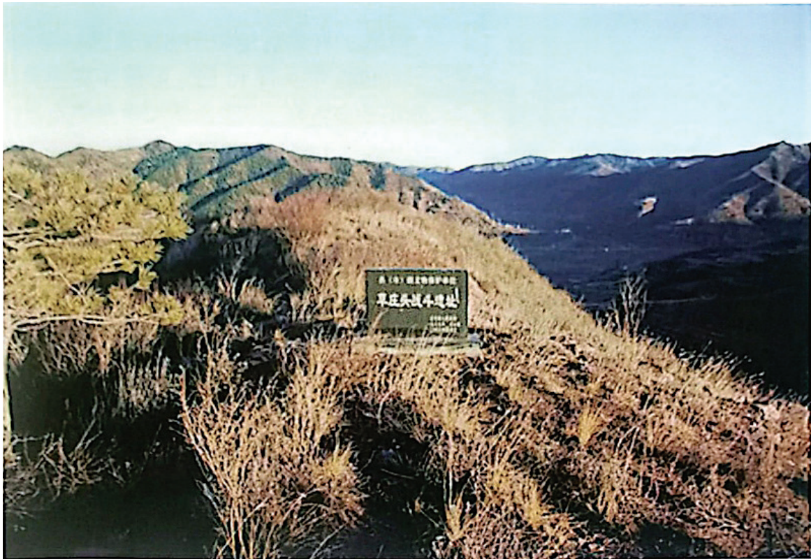
草庄头战斗遗址（资料图片）

这次战斗是贯彻毛泽东“把敌人挤出去”的经典战例。晋绥军区司令部特予通令嘉奖，晋绥边区《抗战日报》更盛赞此战为“里应外合全歼守敌之典范”。这就是著名的拔除草庄头战斗据点。 草庄头战斗遗址位于古交市邢家社乡草庄头村西300米的山梁上。抗日战争时期，日军在此筑起碉堡，像插入根据地的一把尖刀。 1943年9月18日夜晚，寂静的山梁上突然响起猛烈的爆炸声，拔除草庄头据点的战斗打响了……片刻工夫，这个被日军视为固若金汤的据点，在火光中化为一片废墟。