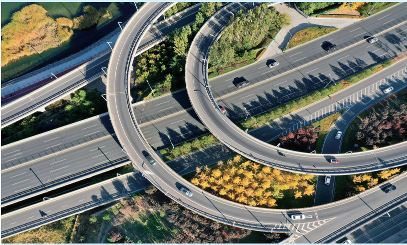
滨河西路北中环段

晨光中苏醒的太原城，道路网络如流淌的韵律——滨河路上车流似金色琴弦轻颤，胜利街焕然一新，路灯若星轨蜿蜒铺展，北中环街的立交如蝶翼舒展……这座群山环抱的城市，正以路为笔，在黄土高原上挥毫泼墨，绘就四通八达的现代图景。 太原的经脉在纵横延展。迎泽大街与解放路经纬交织，织密核心城区的通行网络；长风西街向汾河西岸舒展臂膀，牵引着繁华跨越水域；东西山旅游公路环抱城郭，将蒙山、太山、晋祠、天龙山等胜景串成翠色珠链。当南中环桥迎来新生蜕变，整座城市的交通脉络便随之调整呼吸，在智慧调度中维系着川流不息的韵律。 太原的筋骨正向远山舒张。古交至娄烦方向的长龙即将穿山越岭，把丰饶物产更快地汇入城市血脉，让红色记忆与都市文旅紧紧