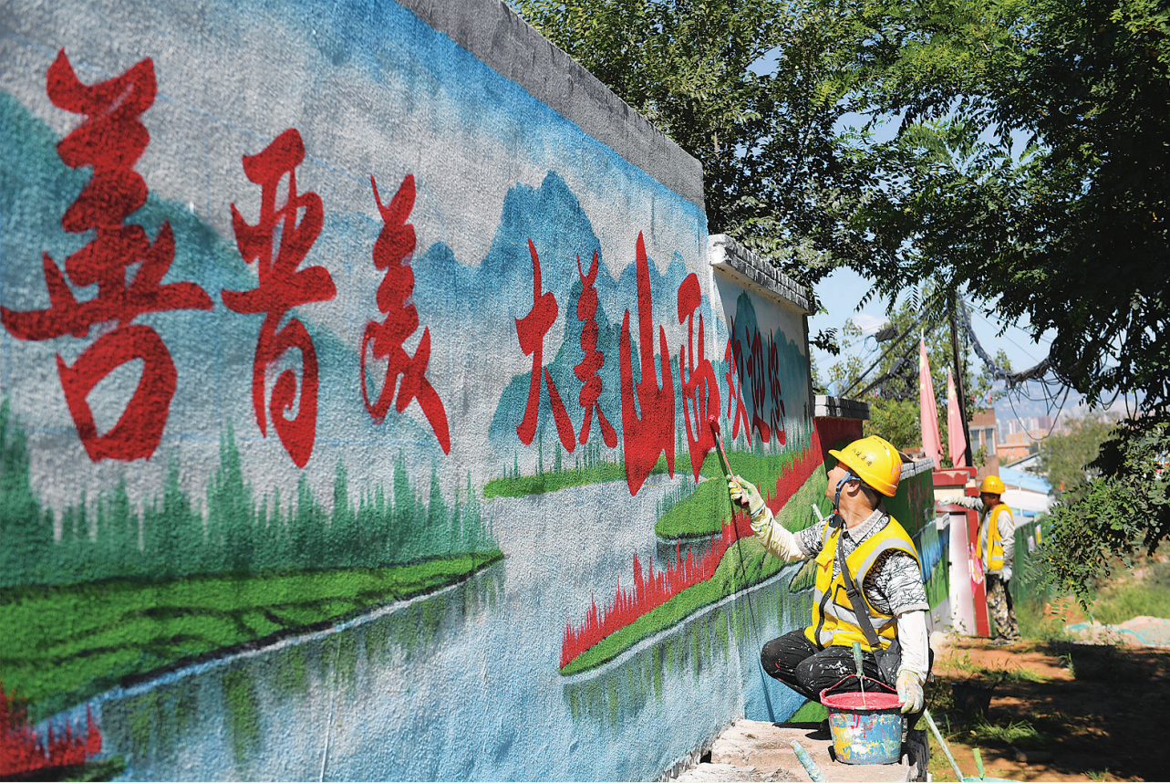
7月31日,杏花岭区中涧河镇后沟村,工人正在绘制景观墙。该区积极推进美丽乡村建设,改善人居环境,促进美丽生态、美丽经济、美好生活有机融合。