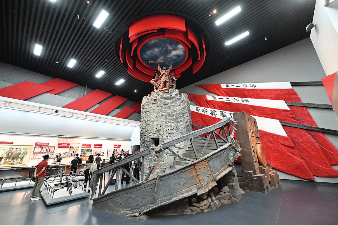
这是7月7日拍摄的百团大战纪念馆展厅。