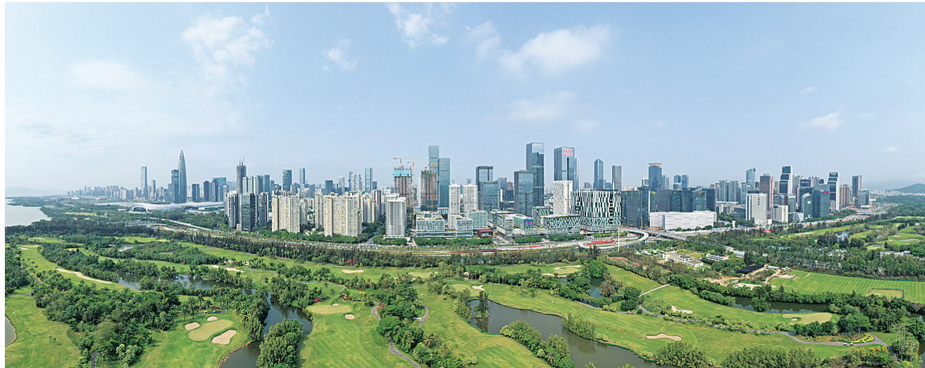
这是2020年3月27日在深圳市南山区拍摄的大沙河沿岸景色(无人机照片)。