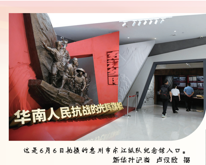
这是6月6日拍摄的惠州市东江纵队纪念馆入口。

8月5日13时许，云南磨憨铁路口岸人流如织，搭乘中老铁路D87次列车前往老挝的旅客正排队等候通关。 正值暑运，“跨境游”热度持续攀升的中老铁路，不仅极大便利了两国的交通往来，更成为推动区域旅游合作的新引擎。磨憨边检站执勤四队负责人孟涛介绍，今年前7个月，磨憨铁路口岸共计验放出入境旅客14.6万人次，同比增长10%。 现代交通网络四通八达，推动经济融通、人文交流，使世界成为紧密相连的“地球村”。 中俄黑河公路桥、秘鲁钱凯港等重大项目建设投运；中欧班列累计开行超过11万列，西部陆海新通道海铁联运班列年度开行近万列，中欧跨里海直达快运正式开通……一条条路、一座座桥、一个个港，成为新时代的驼铃帆影、大道驿站。 建立中国—中亚交通部长会议、中国—拉共体交通合作论坛等区域合作新机制；实施全球可持续交通人文交流高级研修项目……纵使国际局势波谲云诡，开放合作的脚步从未停下，我国交通国际合作“朋友圈”越来越大。 一通惠天下，万里尚为邻。 刘伟表示，锚定加快建设交通强国战略目标，将全力做好“十四五”收官和“十五五”规划编制工作，加快推进交通运输一体化融合、安全化提升、智慧化升级、绿色化转型，为以中国式现代化全面推进强国建设、民族复兴伟业提供坚强有力的交通运输保障。 新华社记者（新华社北京8月6日电）