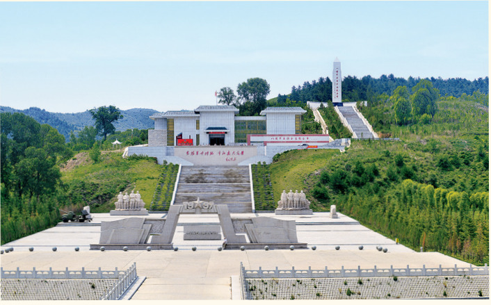
八路军石拐会议纪念馆(晋中市)