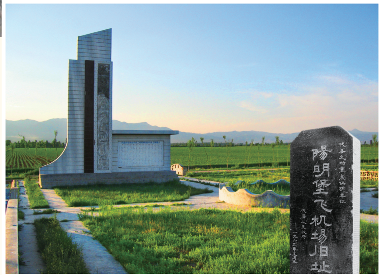
阳明堡日军飞机场旧址(忻州市)