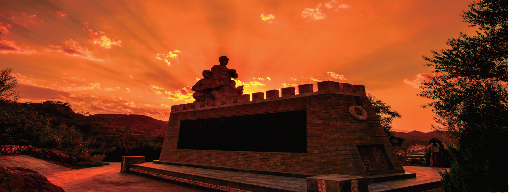
忻口战役遗址(忻州市)