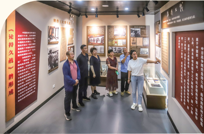
“《论持久战》在山西”展览馆(太原市)