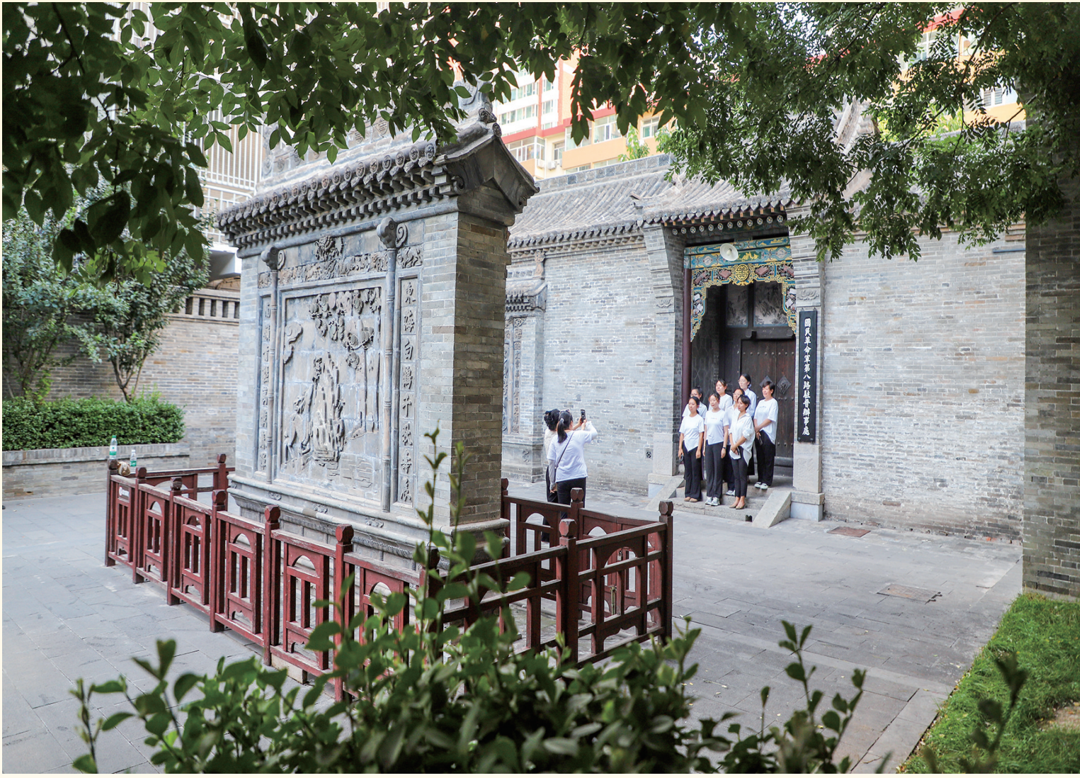
八路军驻晋办事处旧址纪念馆(太原市)