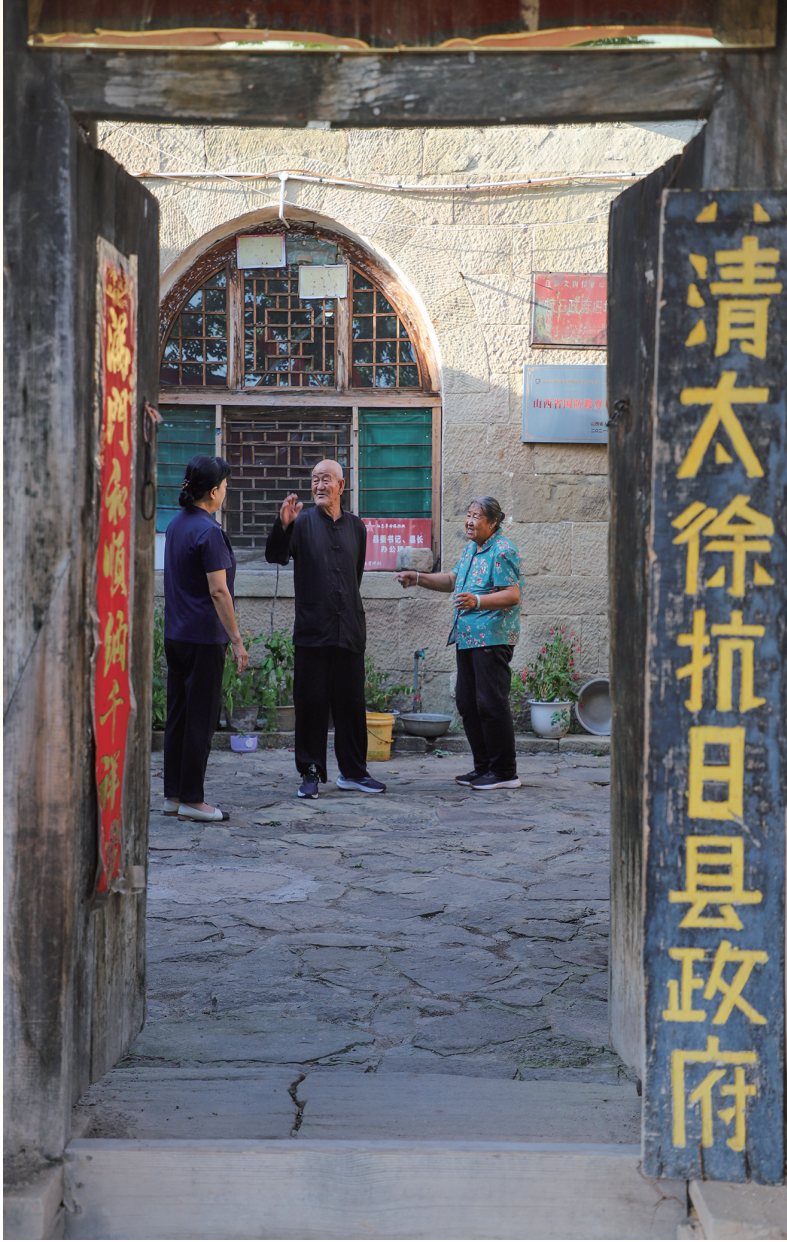
清太徐抗日县政府旧址(太原市)