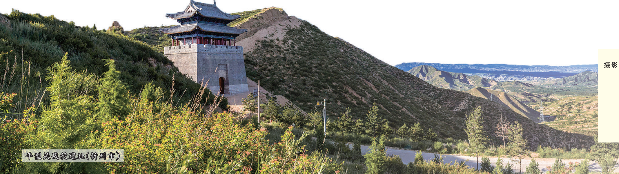
平遥县古城遗址(忻州市)