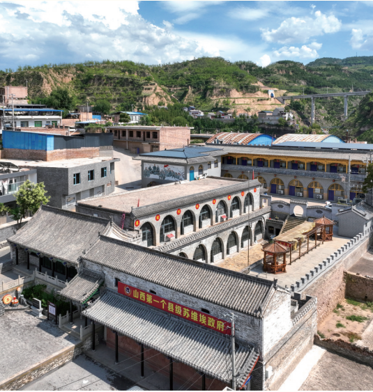
中阳县苏维埃革命委员会旧址(吕梁市)