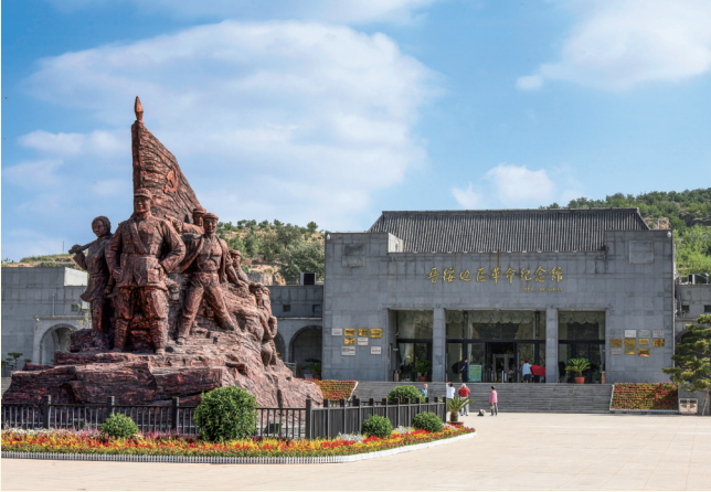
晋绥边区革命纪念馆(吕梁市)