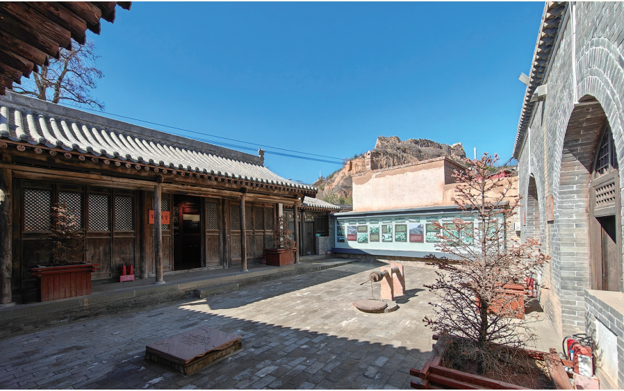
八路军358旅指挥部旧址(太原市)