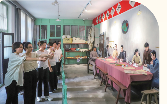
牺盟会太原市委旧址(太原市)