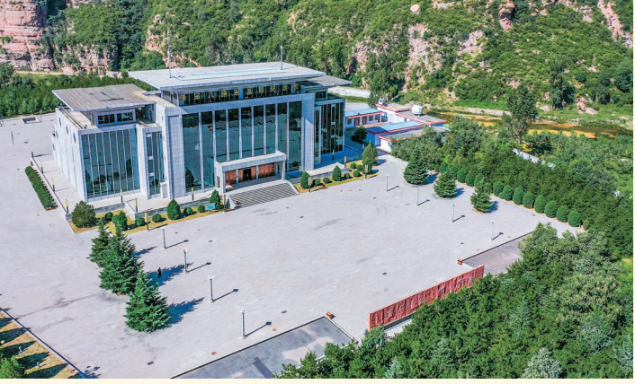
麻田八路军总部纪念馆(晋中市)