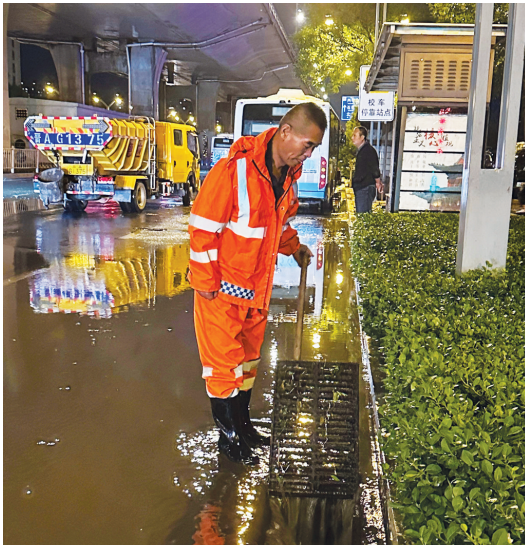
工作人员在西中环上执勤

各部门严阵以待,组织专人对河道堤防、低洼易涝区、地质灾害隐患点等重点部位开展“拉网式”排查,及时消除安全隐患。目前,各县(市、区)防汛工作平稳有序,相关部门和岗位的工作人员24小时值守,全力保障安全度汛。