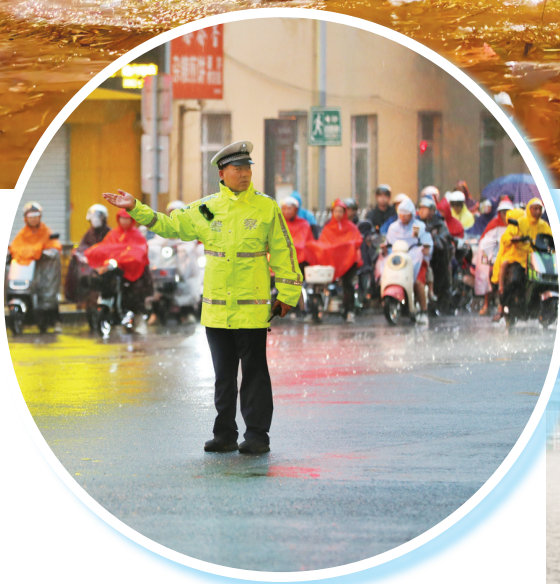
交警在南内环街新建南路口进行疏导指挥,保障道路安全畅通。