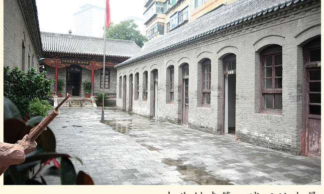
中共创建第一城旧址内景