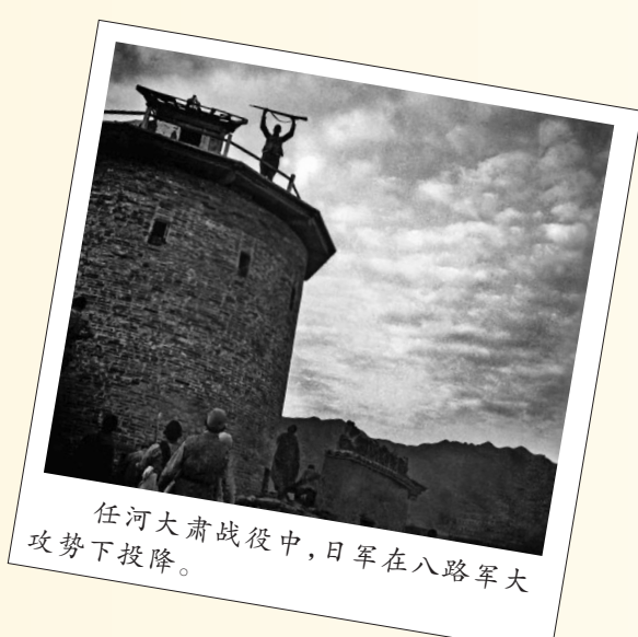
任河大肃战役中，日军在八路军大攻势下投降。