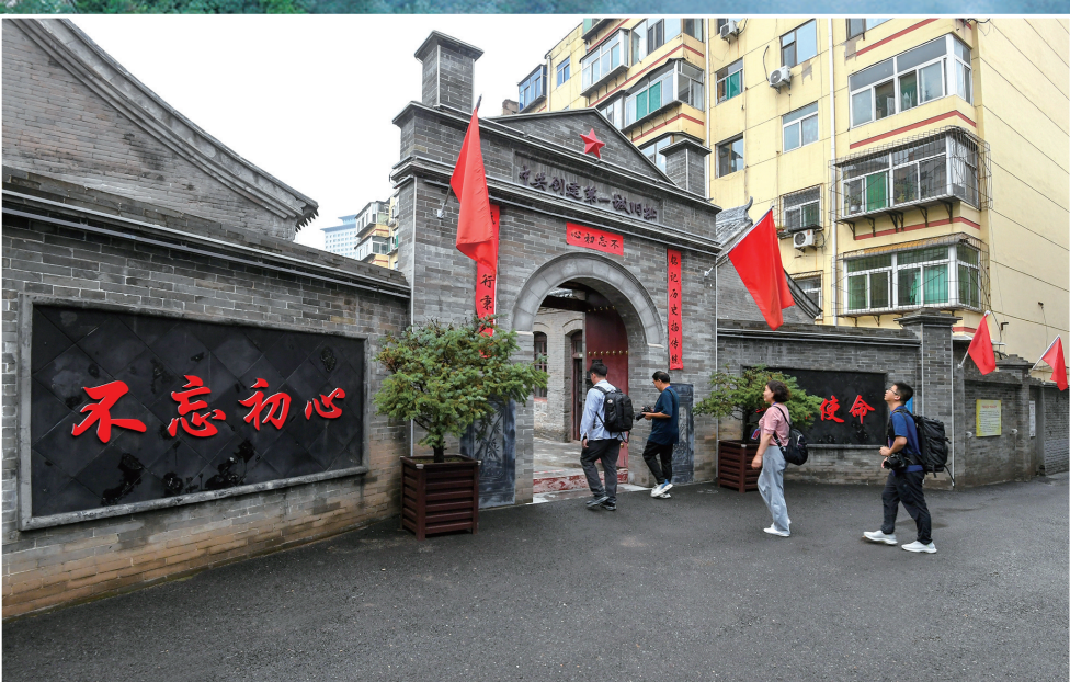
中共创建第一城旧址