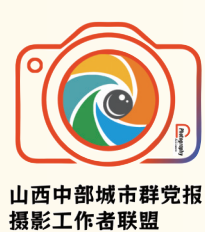
山西中部城市群党报摄影工作者联盟

山巍巍，水泱泱。 阳泉，一座以泉为名、以红为魂的城，静卧三晋东陲，承千年之沧桑，纳百代之风云。这里是中国共产党创建的第一座人民城市，138处红色遗址如星火散布，74处事件旧址、12处人物纪念馆，无声诉说着烽火岁月的铮铮铁骨与浩荡情怀。 8月26日至28日，山西中部城市群党报摄影工作者联盟在阳泉市开展以“英雄之城·魅力阳泉”为主题的大型采风活动。活动期间，太原日报社、阳泉日报社、晋中日报社、忻州日报社、吕梁日报社的骨干记者走进百团大战纪念馆，在珍贵的历史文物与翔实的史料中，重温百团大战的峥嵘岁月；步入“中共创建第一城”旧址，感受阳泉的历史脉络与时代变迁。 狮脑山上，百团大战纪念碑如利剑指天，两侧烽火台巍然对峙，砖石“长城”蜿蜒起伏。它铭记的不仅是一场战役，更是一个民族的不屈脊梁。主战场之一的狮脑山，曾响彻八路军破袭交通、攻坚据点的号角，也曾映照无数坚毅的面庞。百团大战纪念馆中，470余幅图片、200余件实物、10余处场景，将