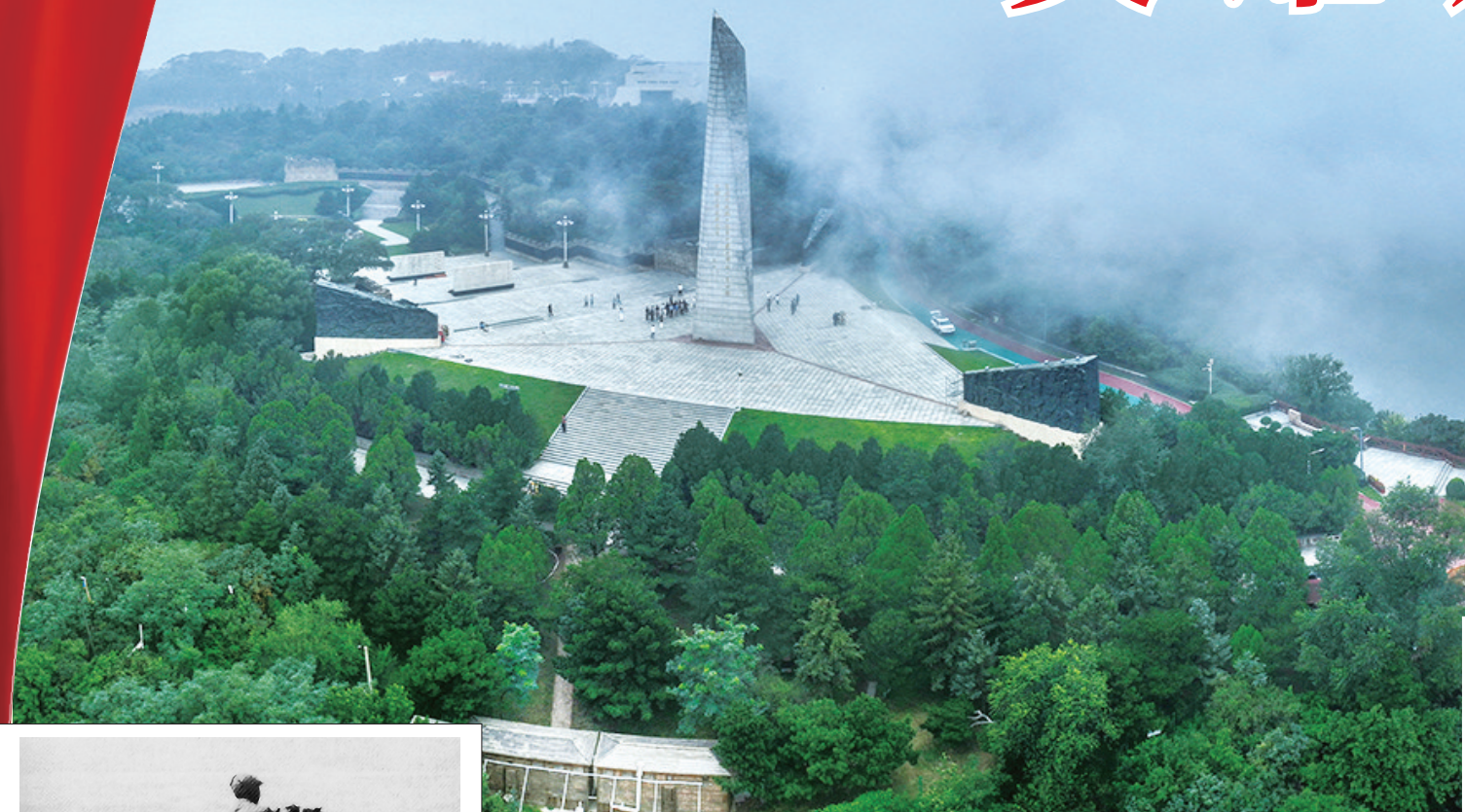
▲百团大战纪念碑