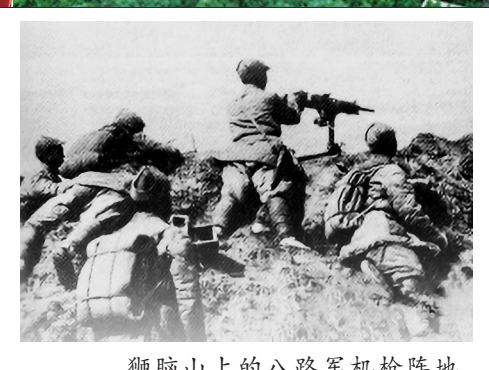
狮脑山上的八路军机枪阵地。