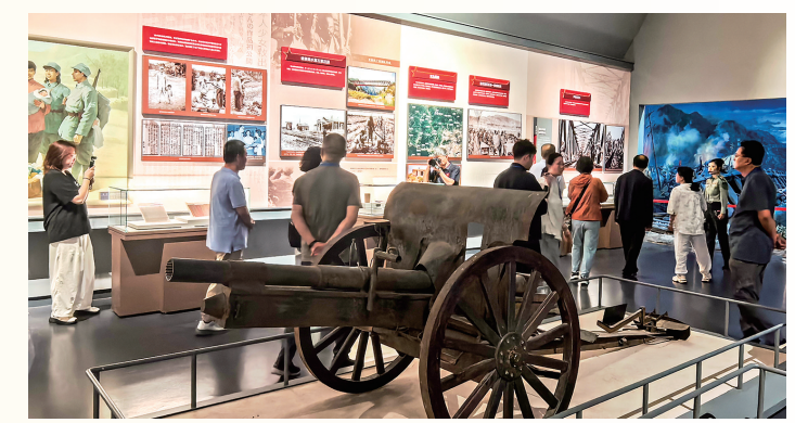
采风团记者参观百团大战纪念馆