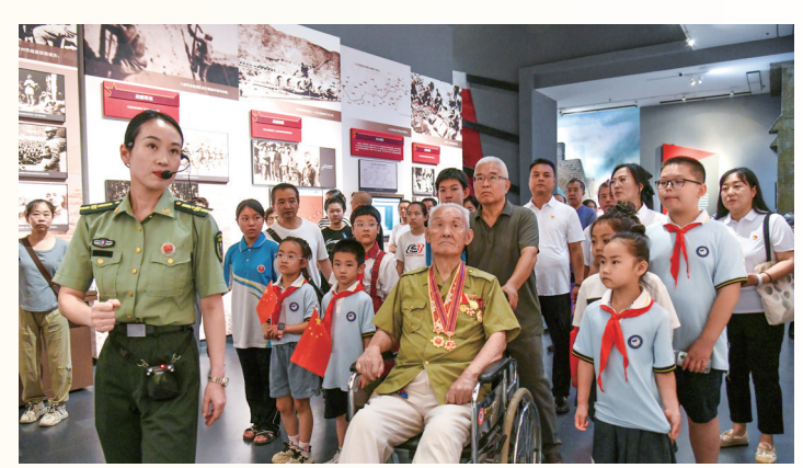
观众在百团大战纪念馆听讲解

“运筹帷幄”“百团出击”“乘胜追击”等七大部分娓娓道来。声光电交织间，历史不再是遥不可及的往事，而是可触可感的民族记忆。 1947年春，阳泉从一座关隘小镇跃升为“中共创建第一城”。桥北街保晋巷深处，青砖门楼肃穆庄严，五星红旗迎风飞扬。这里曾是中国共产党人“进京赶考”的第一个“城市脚印”。阳泉解放、建市、贡献的历程，在一幅幅影像、一件件实物中缓缓展开。她不仅为共和国城市政权建设提供了宝贵经验，更以一系列安定民生、恢复生产、稳定物价的举措，奠定了社会主义城市的雏形。 八十年风雨如磐，八十年血脉不绝。 今日阳泉，红色基因已深深融入城市肌理、人民血脉。从百团大战纪念馆到“阳泉记忆·1947”文化园，从“中共创建第一城”旧址到数字经济产业园，阳泉儿女用科技赋能转型，用实干致敬先辈，在这条从烽火走向复兴的大道上继续铿锵前行。 历史无言，山河为证；精神不灭，代代相传。