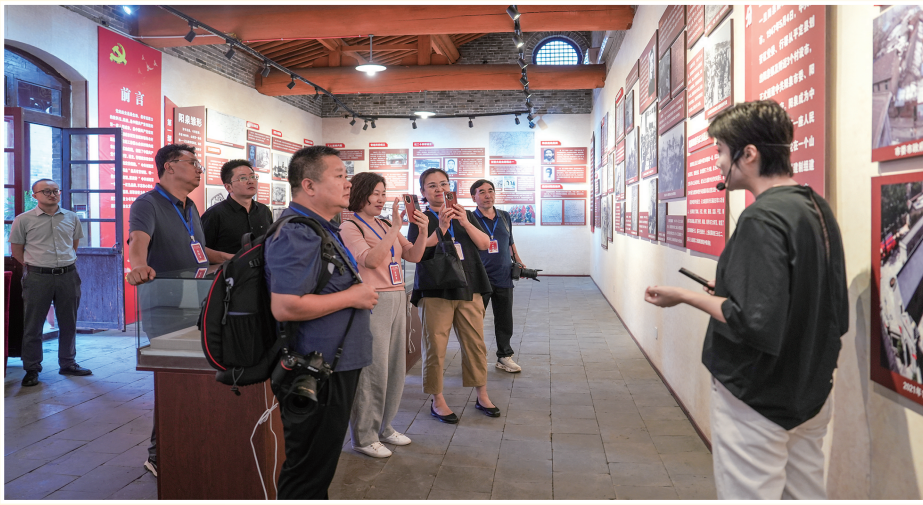
采风团记者参观中共创建第一城旧址