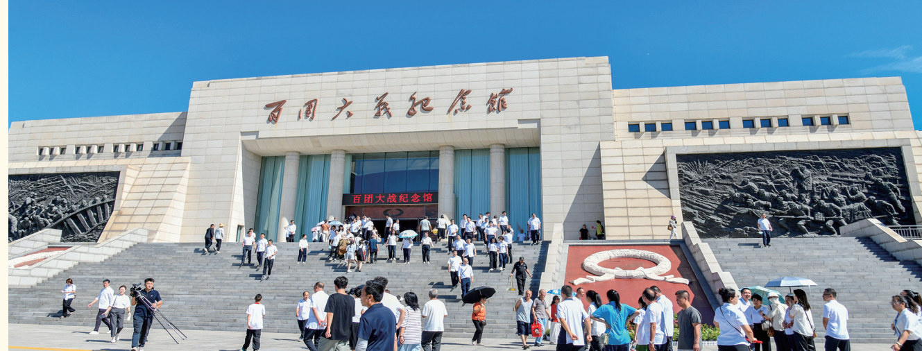
百团大战纪念馆