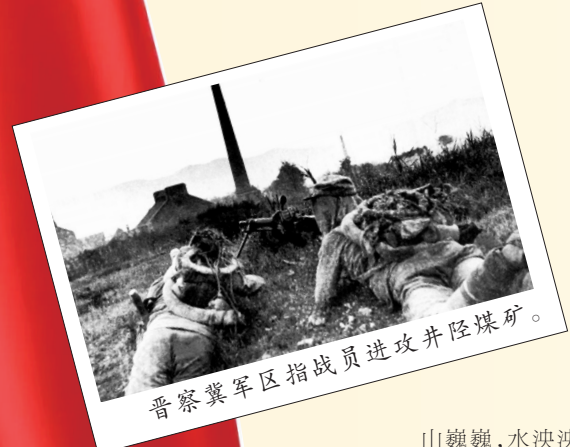
晋察冀军区指战员进攻井陉煤矿。