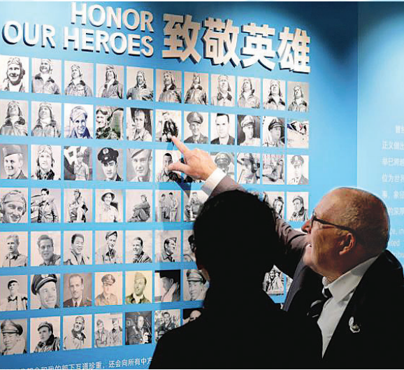
7月8日，人们在上海黄浦文化中心参观“铭记英雄 共创未来”飞虎队主题历史图片展。