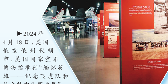
►2024年4月18日，美国俄亥俄州代顿市，美国国家空军博物馆举行“缅怀英雄——纪念飞虎队和杜立特中队图片展”。