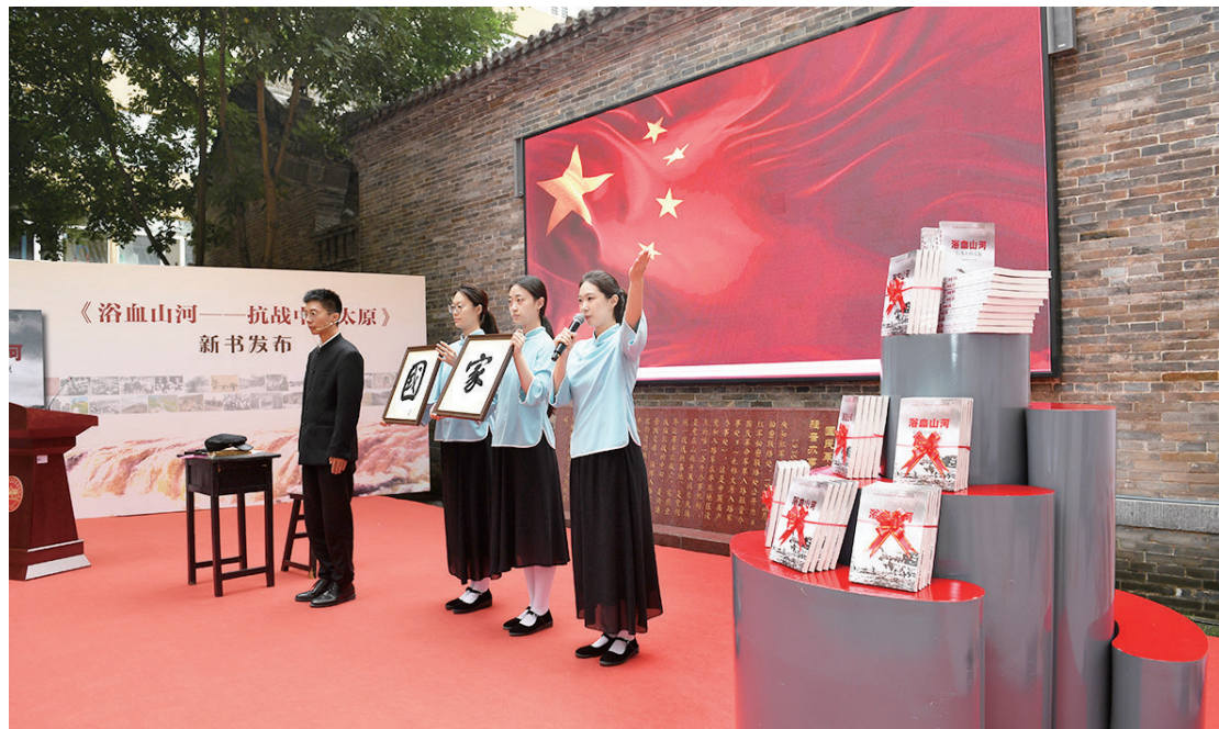
9月2日,《浴血山河——抗战中的太原》新书发布会在八路军驻晋办事处旧址举行。

本报讯 今年是中国人民抗日战争暨世界反法西斯战争胜利80周年。为铭记抗战历史,传承红色基因,9月2日,《浴血山河——抗战中的太原》新书发布会在八路军驻晋办事处旧址举行。 活动现场氛围庄重热烈,以《书生报国无他物 唯有手中笔作刀》《迟来的团聚》两段红色情景演绎为序,重现抗战时期青年的家国担当,引发在场观众强烈共鸣。