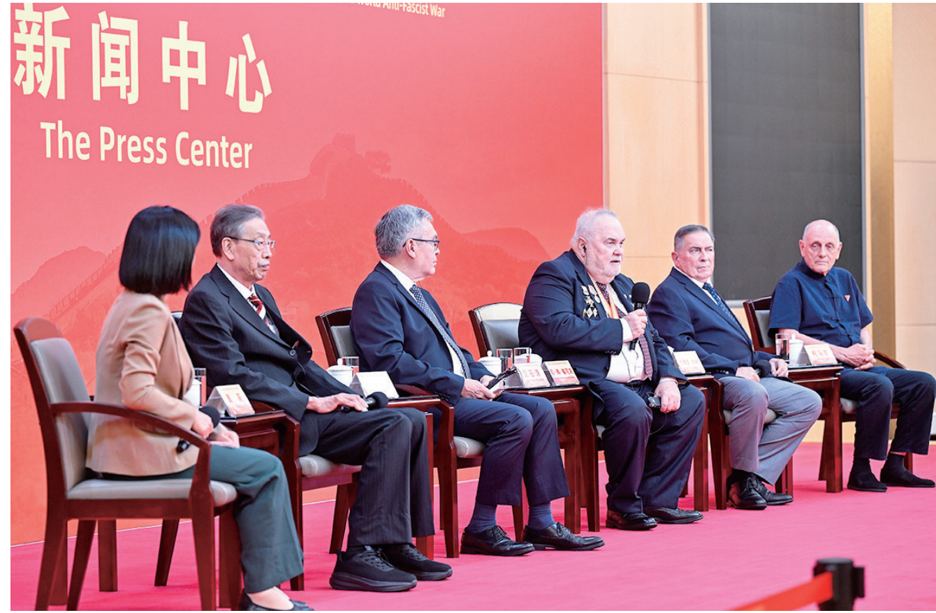
9月2日上午，中国人民抗日战争暨世界反法西斯战争胜利80周年纪念活动新闻中心举办第三场记者见面会，为中国抗战胜利作出贡献的国际友人或其遗属代表介绍对中国人民抗日战争的认识等方面情况，并回答记者提问。

“飞虎队这个名字就是中国人民给美国飞行员起的。”美中航空遗产基金会主席杰弗里·格林分享感人至深的历史细