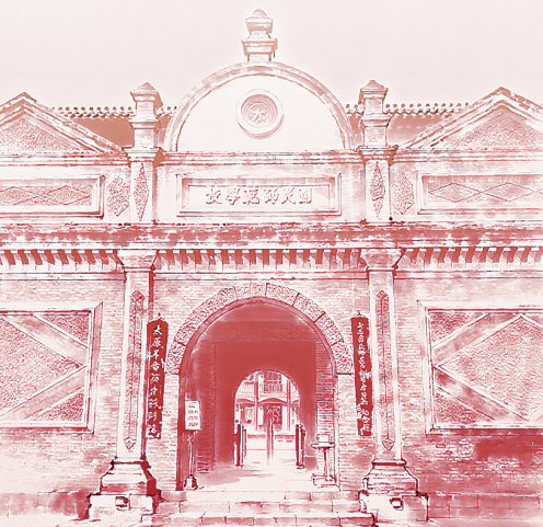
山西国民师范旧址革命活动纪念馆(AI生成)

太原自古便有“中原北门”之称,在军事防御与战略机动中占据天然优势。近代以来,其独特的地理区位与交通优势,促进了民族工商业繁荣,孕育了早期工人阶级。五四运动后,马克思主义思想在此落地生根,太原社会主义青年团、中共太原支部、牺盟会等革命组织相继成立,为三晋大地播撒革命火种。穿过历史的长河,那些曾点燃革命烽火 的组织、曾响彻云霄的呐喊、曾奋勇拼杀的身影,都已沉淀为太原大地上珍贵的红色文化资源。