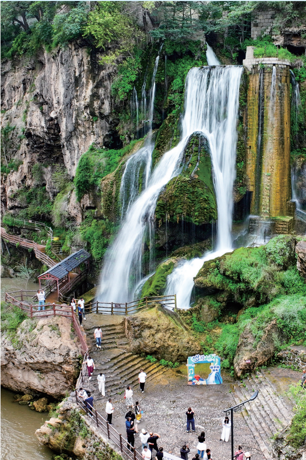
娘子关瀑布