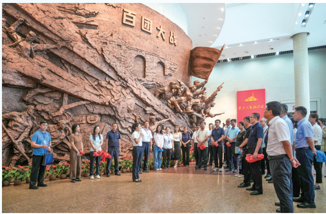
百团大战纪念馆