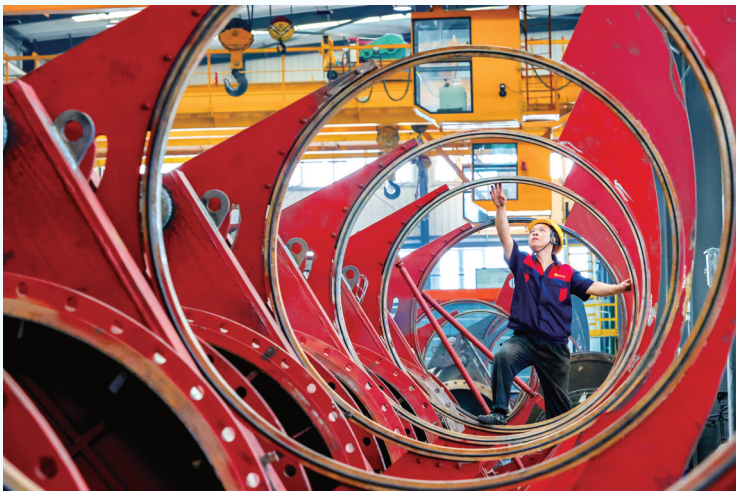
阳泉阀门股份有限公司成品车间

本报于9月1日刊发《英雄城 阳泉红》视觉专版，展现了这座英雄之城的红色内涵，今日带领读者进一步了解这座现代之城的活力、魅力。