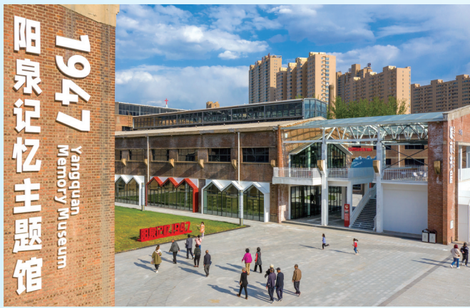
阳泉记忆·1947主题馆