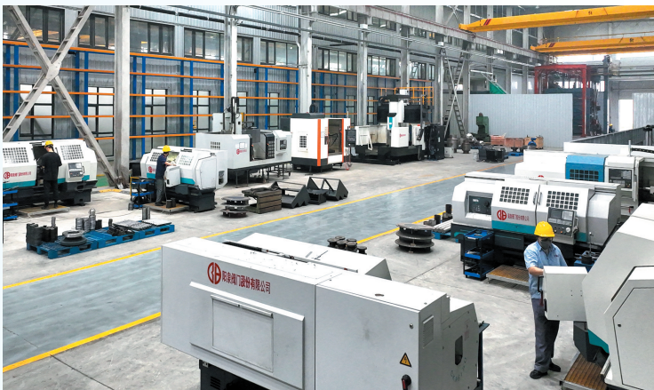
阳泉阀门股份有限公司装配车间