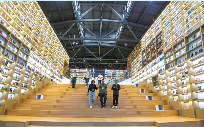
阳泉记忆·1947主题馆城市书房