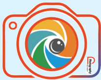
山西中部城市群党报摄影工作者联盟