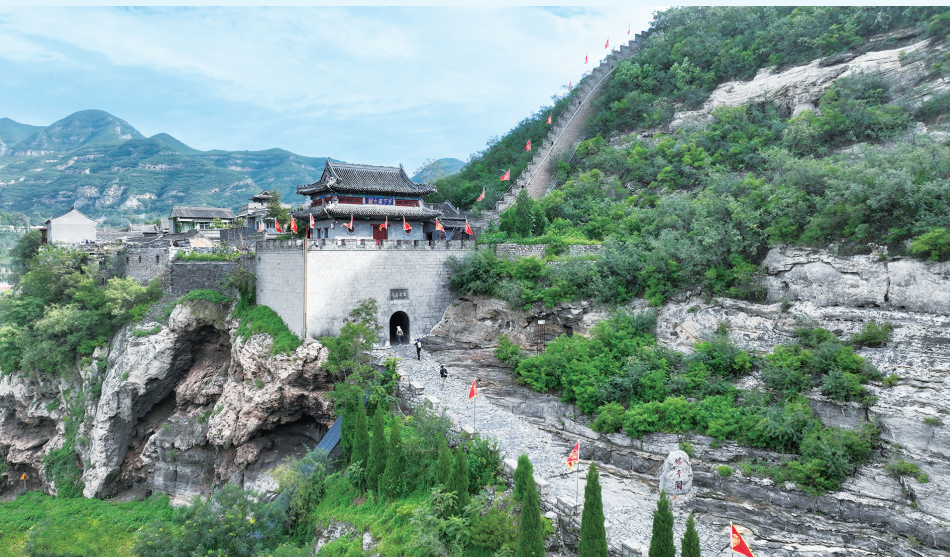
娘子关景区