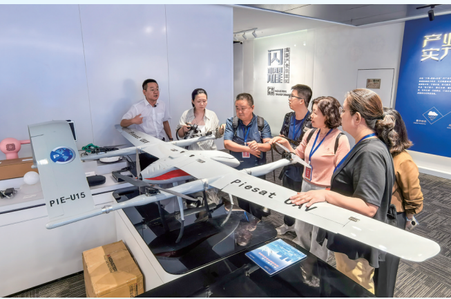
山西智创城7号