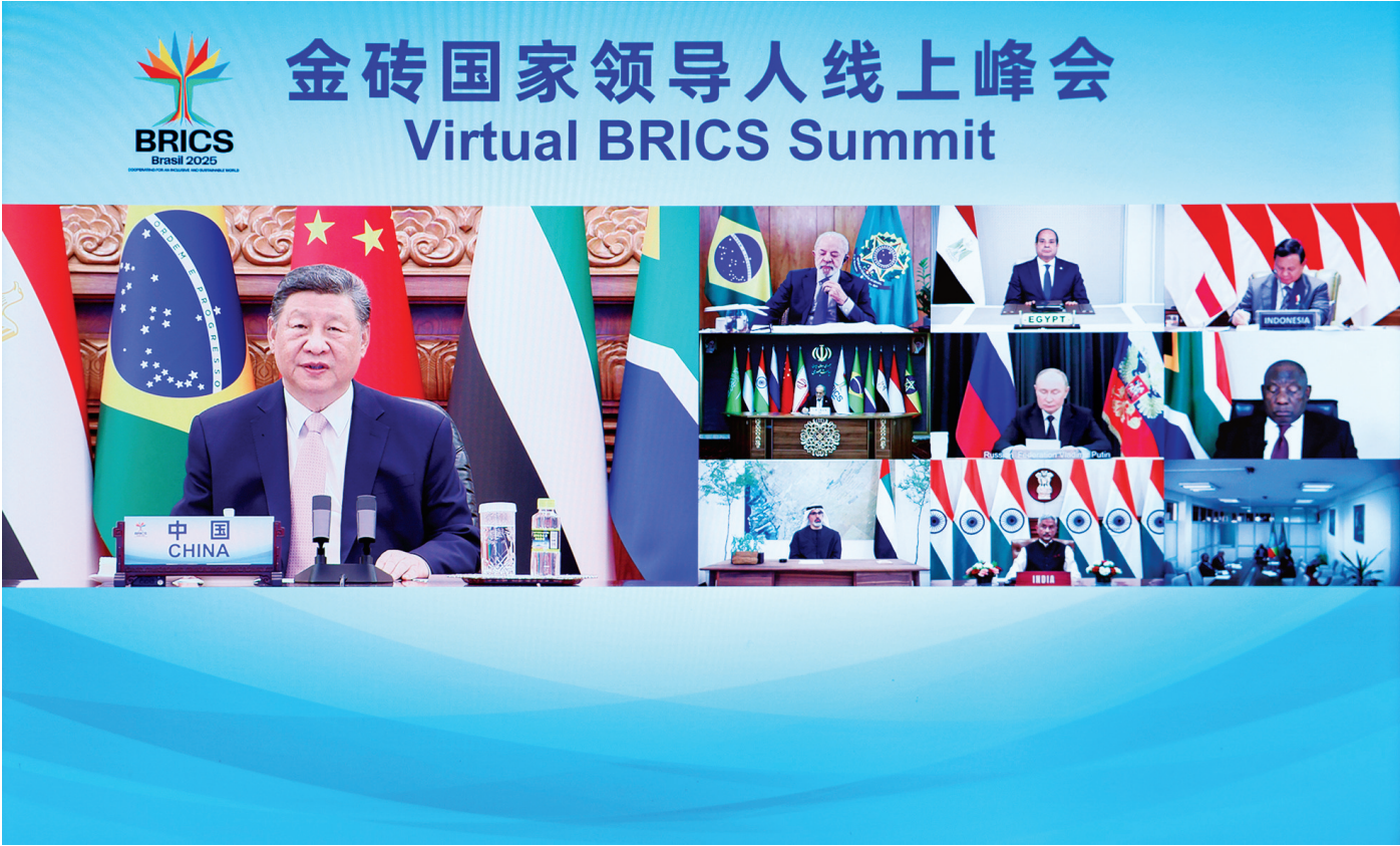
9月8日晚，国家主席习近平出席金砖国家领导人线上峰会，并发表题为《团结合作 砥砺前行》的重要讲话。