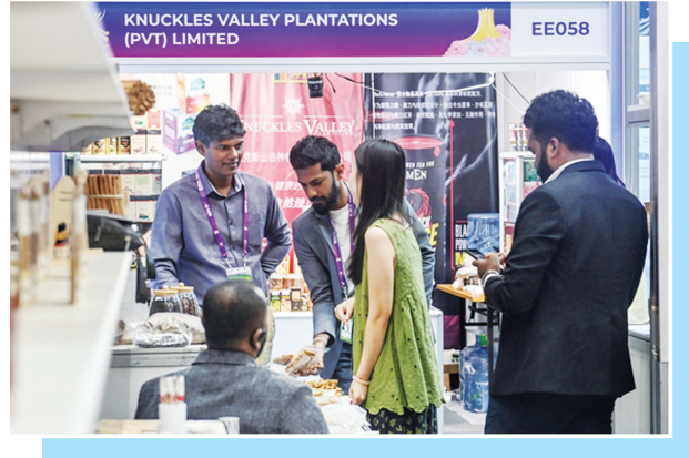
9月20日，在广西南宁国际会展中心，斯里兰卡客商在展馆布置当日工作。

【现实场景】只需手机一扫，唤醒AI会展智能体，输入合作意向，系统便迅速精准匹配符合条件的展商——本届东博会上，客商们有了寻觅商机的“新利器”。