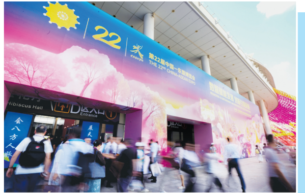
这是9月17日拍摄的广西南宁国际会展中心。

【点评】作为中国和东盟共同维护和深化自由贸易的标志性成果，3.0版促进从互降关税向共建标准规制转变，将构建起更加便利的贸易环境、更加开放的市场空间，为区域和全球贸易注入更多的确定性。