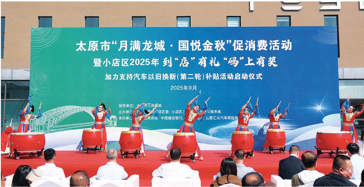
9月25日，太原市“月满龙城·国悦金秋”促消费活动暨小店区2025年到“店”有礼、“码”上有奖加力支持汽车以旧换新（第二轮）补贴活动启动仪式在汇众汽车家园举办。

者。”小店区政府副区长郭丽河表示，今年以来，小店区已经先后7次承办省、市“晋情消费·以旧换新”等促消费活动，持续点燃消费热潮，尤其是3月份区级主办首轮汽车补贴活动，当月汽车销售额超24亿元，同比增长超30%、环比增长超70%，新能源汽车同比增长超40%，政