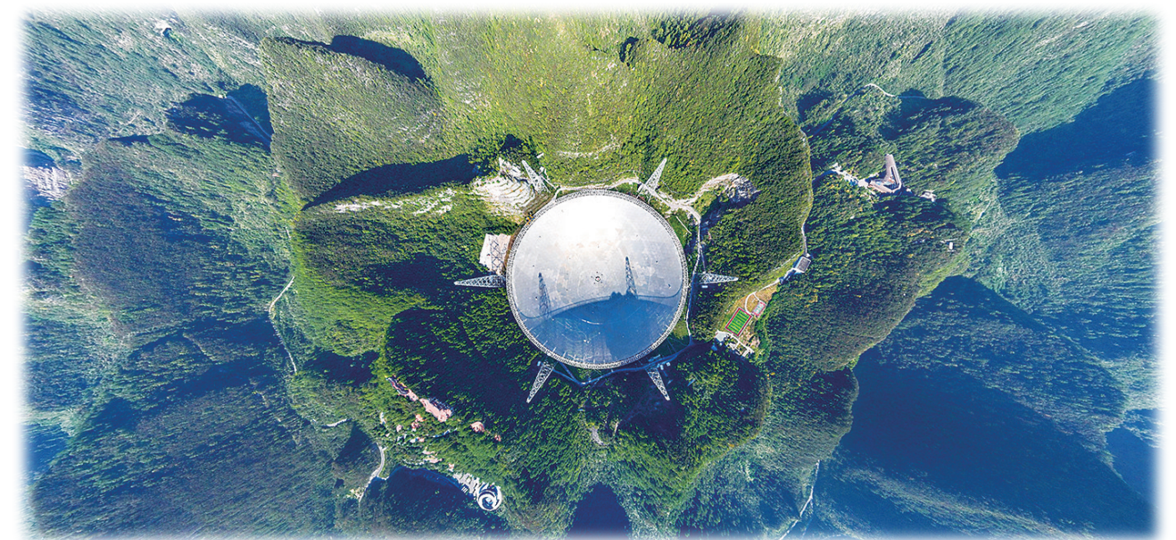
这是2024年9月25日拍摄的“中国天眼”全景(无人机照片,维护保养期间拍摄)。