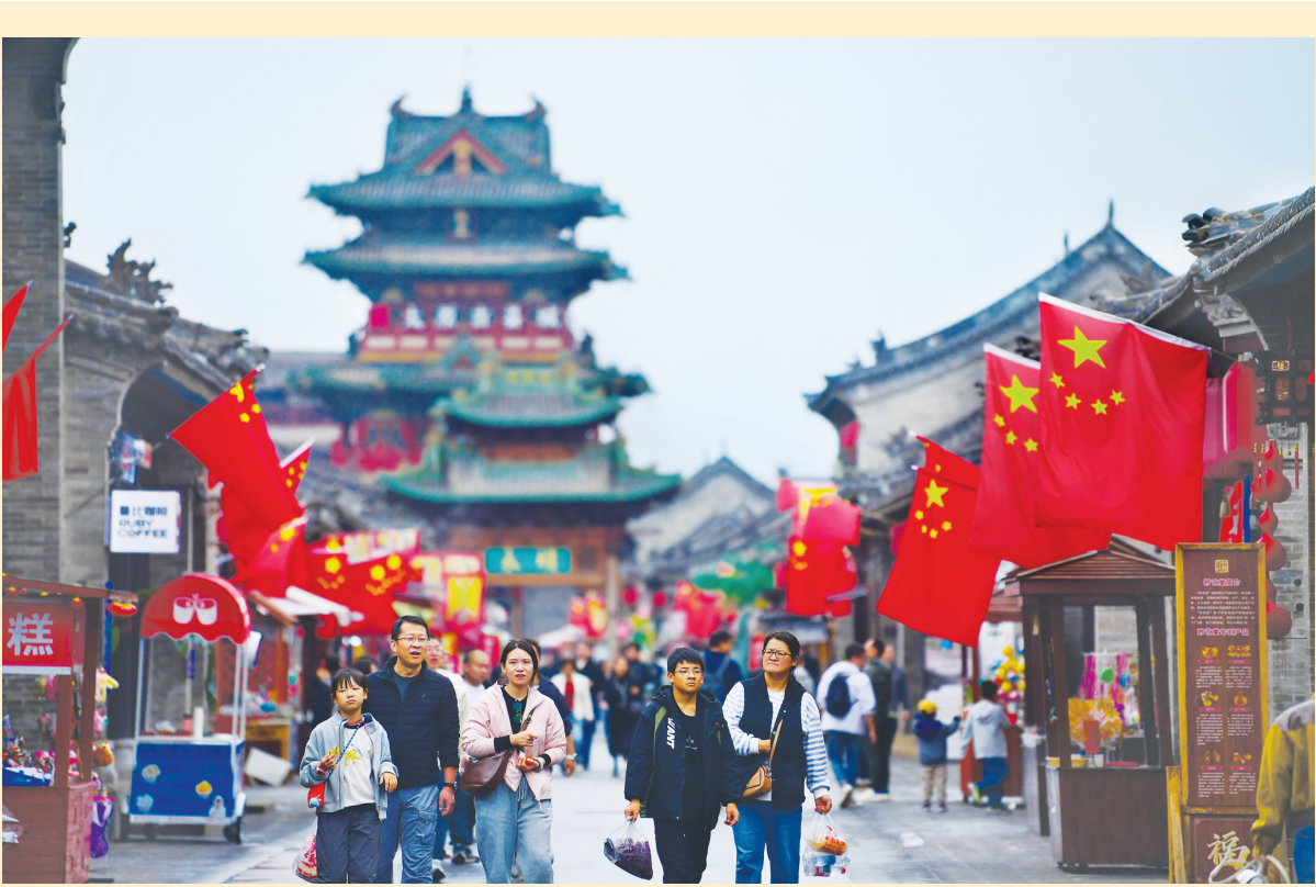
10月6日,游客漫步太原古城。国庆中秋假期,太原古城城里婚俗巡游、杂技演艺、舞狮表演等轮番上场,同时推出国际艺术节、时光集市等活动。耿婧媛 摄