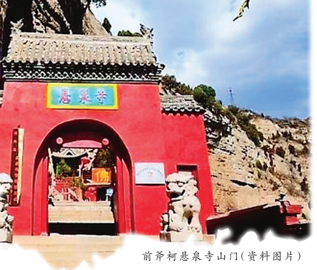
前斧柯悬泉寺山门(资料图片)

章。山崖凹回可抵御狂风暴雨的侵蚀，庙宇一字排列于半山腰，面南依山，北方地区特有的西北风被四周的山峰挡在外面，对寺庙又起到了一层防护作用。 悬泉寺的修建构思，与恒山悬空寺、代县赵杲观有异曲同工之妙，都是充分利用山崖中的裂缝或山洞建造，殿宇如同镶嵌在山崖之中。不同之处在于，悬泉寺的殿宇不是一览无遗，而是随栈道依山势布局。古栈道不仅承担了道路的职能，还为嵌入悬崖绝壁的殿宇充当了基础与踏步的作用。 常规的寺庙第一座大殿多是天王殿，高大的四大天王令每一位朝拜者进门就肃然起敬。悬泉寺选址在半山腰，无法满足天王殿的高大宏敞，于是选择建造尊奉关帝圣君的伽蓝殿，无论从规制还是自然形式，都显得天衣无缝。