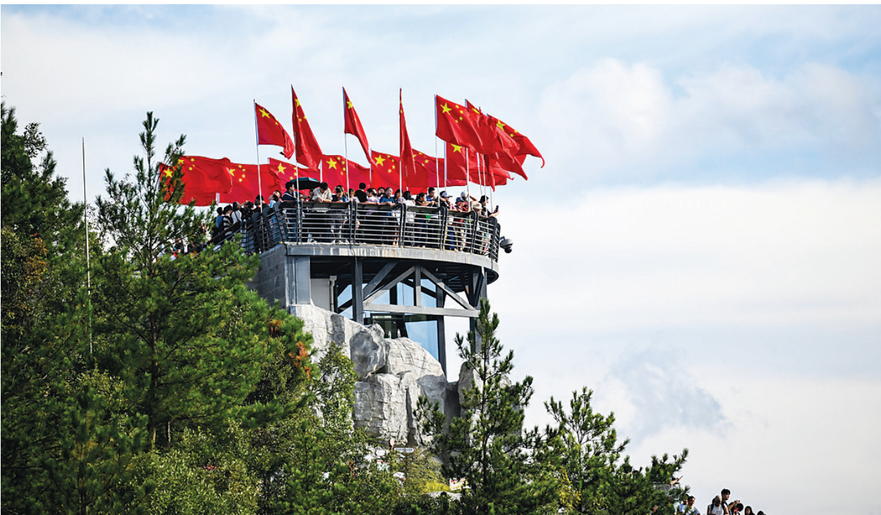
10月5日，游客在重庆奉节三峡之巅景区游览。新华社记者 陈晔华 摄

充满中秋“氛围感”的夜晚，在这个假期格外受到游客欢迎，带动火热的“夜经济”：携程数据显示，“夜游”在携程上的搜索热度环比增幅超200%。上海浦东美术馆、南京博物院等多家场馆夜间热度同