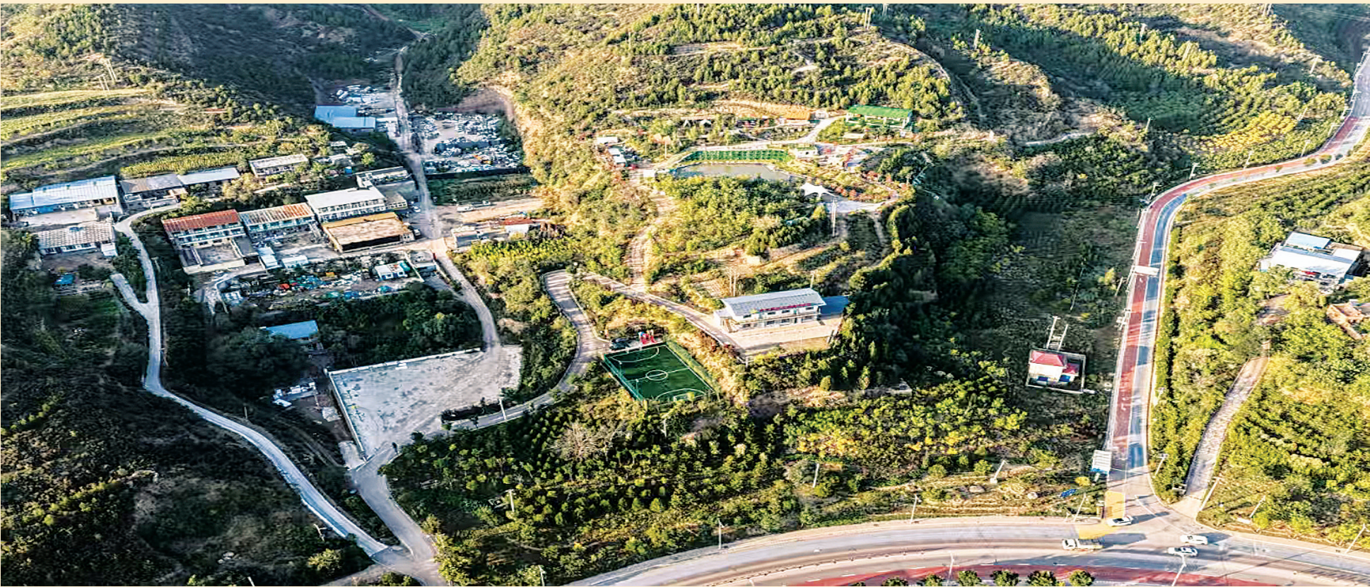
10月11日,俯瞰迎泽区郝庄镇观家峪村,静谧村落与斑斓山色交织,展现出一幅美丽的乡村画卷。

所在分理处/管理部柜台申请办理。办理转入业务时,个人账户由原单位办理封存后,职工本人在手机公积金App自助办理“灵活就业人员转入预约”,按照预约时间前往银行承办网点办理转移业务。 手机公积金App已然成为打开住房公积金未来发展大门的“金钥匙”。近年来,太原市住房公积金管理中心以数字化建设为核心,构建了集中心网站、网上业务大厅、12329服务热线、短信平台、触摸屏自助服务终端、“手机公积金”App客户端、微信公众号等为一体的多渠道数字化综合服务体系。通过数据互联互通,中心已实现了“跨省通办”“全程网办”“全域通办”“一网通办”等多项业务。(贺娟芳)