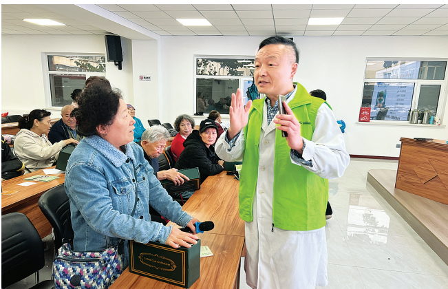
10月11日是第21个“世界安宁缓和医疗日”。10月10日,山西省肿瘤医院组织20余人走进迎泽区青年路二社区,将专业的宁养知识与温暖的关怀送到居民“家门口”。

针对青年们的心声,厂领导认真记录并逐一回应。会后,青年代表们纷纷表示,参加此次座谈会不仅感受到企业的关怀,还明确了奋斗方向,未来将以更饱满的热情投身岗位,用实际行动为企业发展贡献青春力量。(赵静茹)