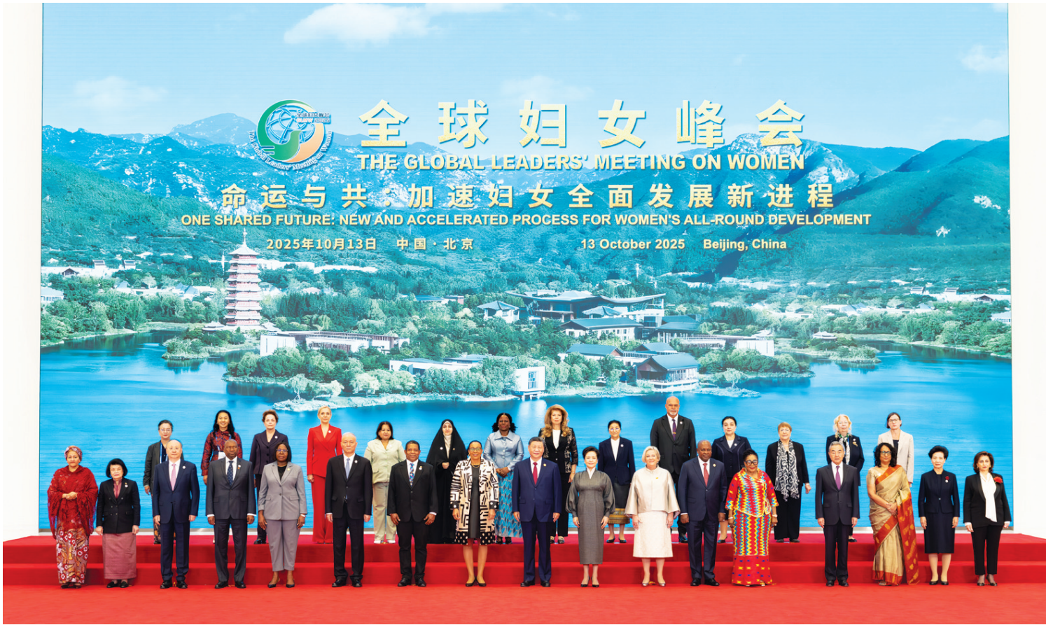
10月13日上午，国家主席习近平在北京国家会议中心出席全球妇女峰会开幕式并发表主旨讲话。这是习近平和夫人彭丽媛同与会各国和国际组织代表团团长夫妇合影留念。