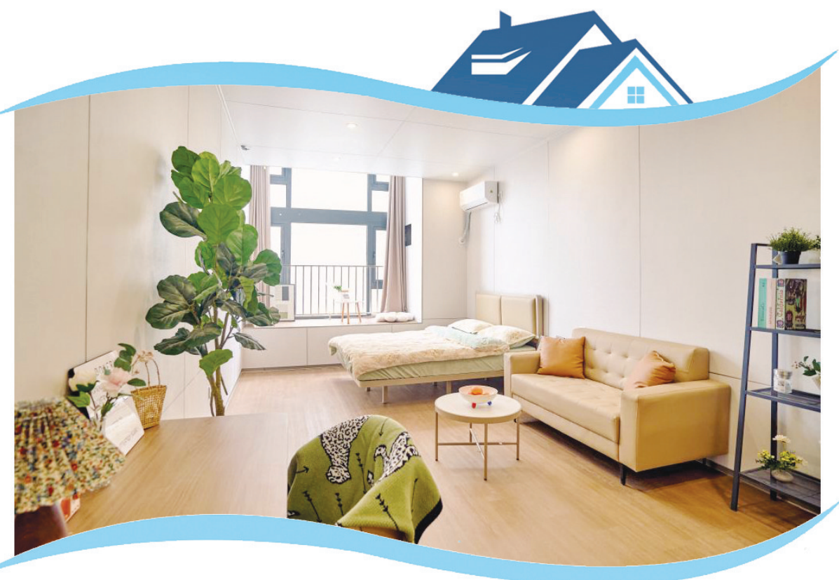
升级改造后的「城发美寓」人才公寓。

《住房租赁条例》施行“满月”之际，记者在北京、山东、河南、四川等地采访了解到，新规落地正推动住房租赁市场发生积极变化，进一步规范市场秩序。人们期待，随着相关配套措施落实落细，租赁双方权益能得到更好保障，为住房租赁行业健康可持续发展注入新动能。